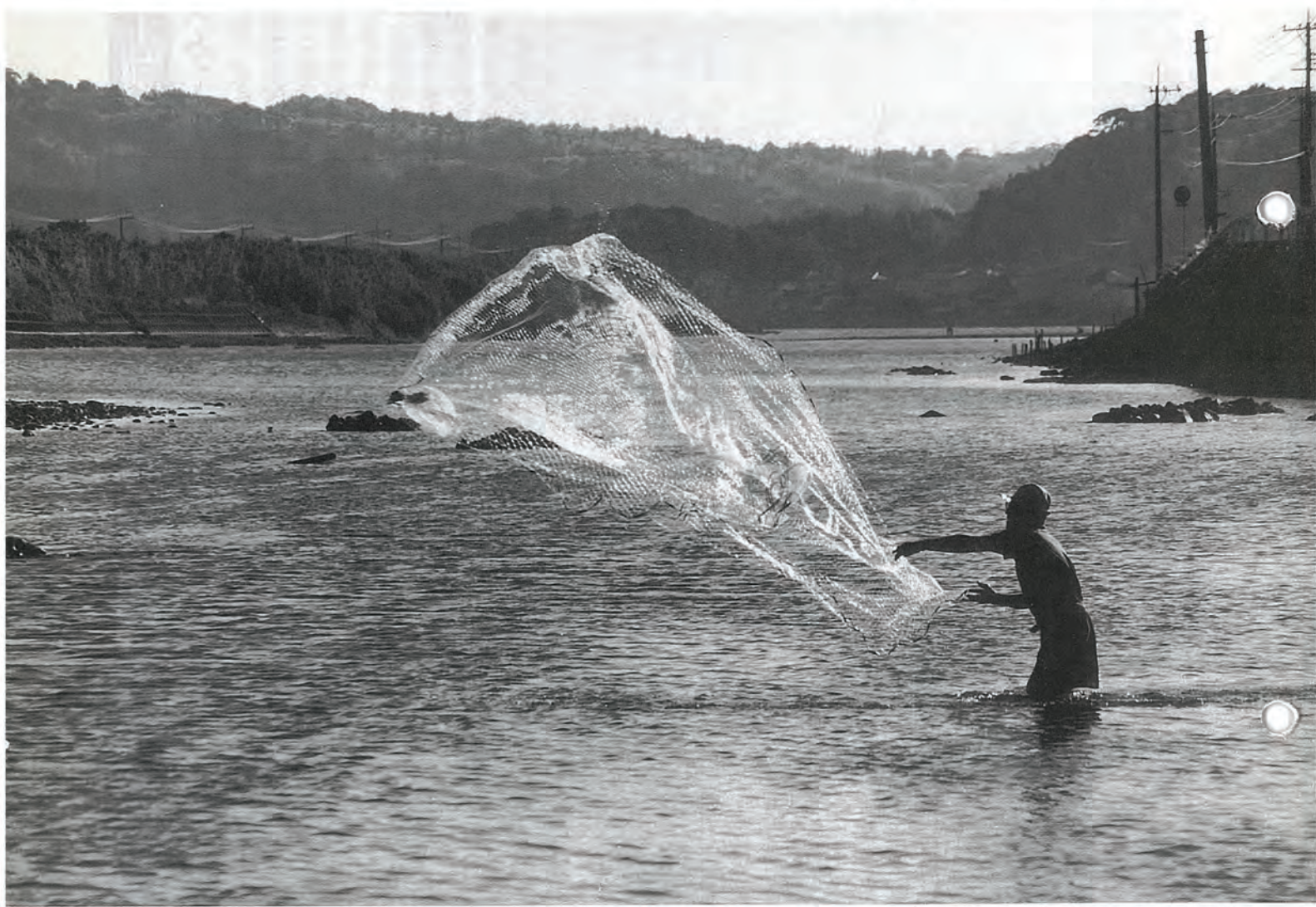
佐々川をきれいにする会写真コンクール会長賞