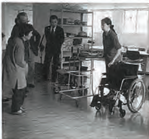
▲歩行機、車イスの説明

その後、佐世保本町の介護者同志の交流会を行ない、介護疲れをいやす、ひと時を過ごされました。