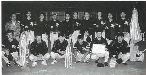
閉会式が終って記念撮影 外はもうまっくら!!