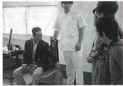
▲リハビリテーション室で介護機器に座って体験

在宅でねたきりや痴呆性の家族の介護をされておられる20数名の方々が、10月にオープンしたばかりの佐世保市内の老人保健施設「サン」を見学され、ショートステイや在宅介護支援センター、デイ