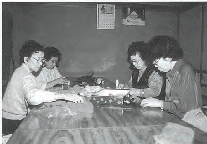
写真は「子どもフェスティバル」用お手玉作りに励む公民館学習(和裁)グループのみなさん