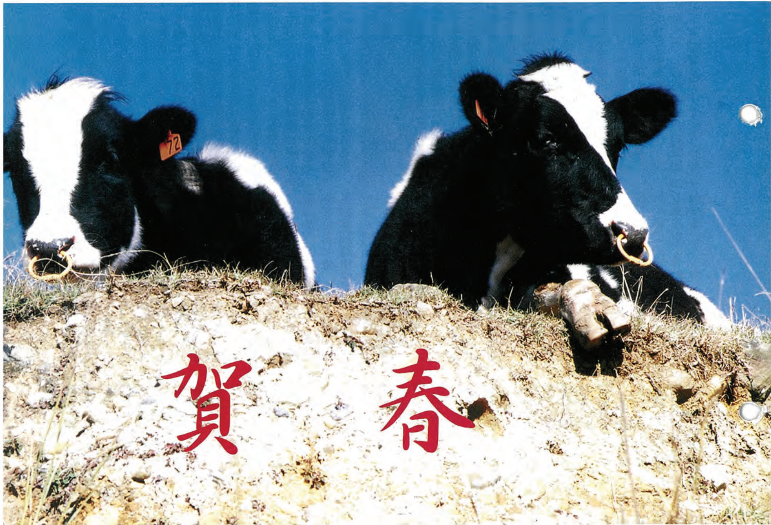
(町内では現在約500頭の牛が飼育されています)