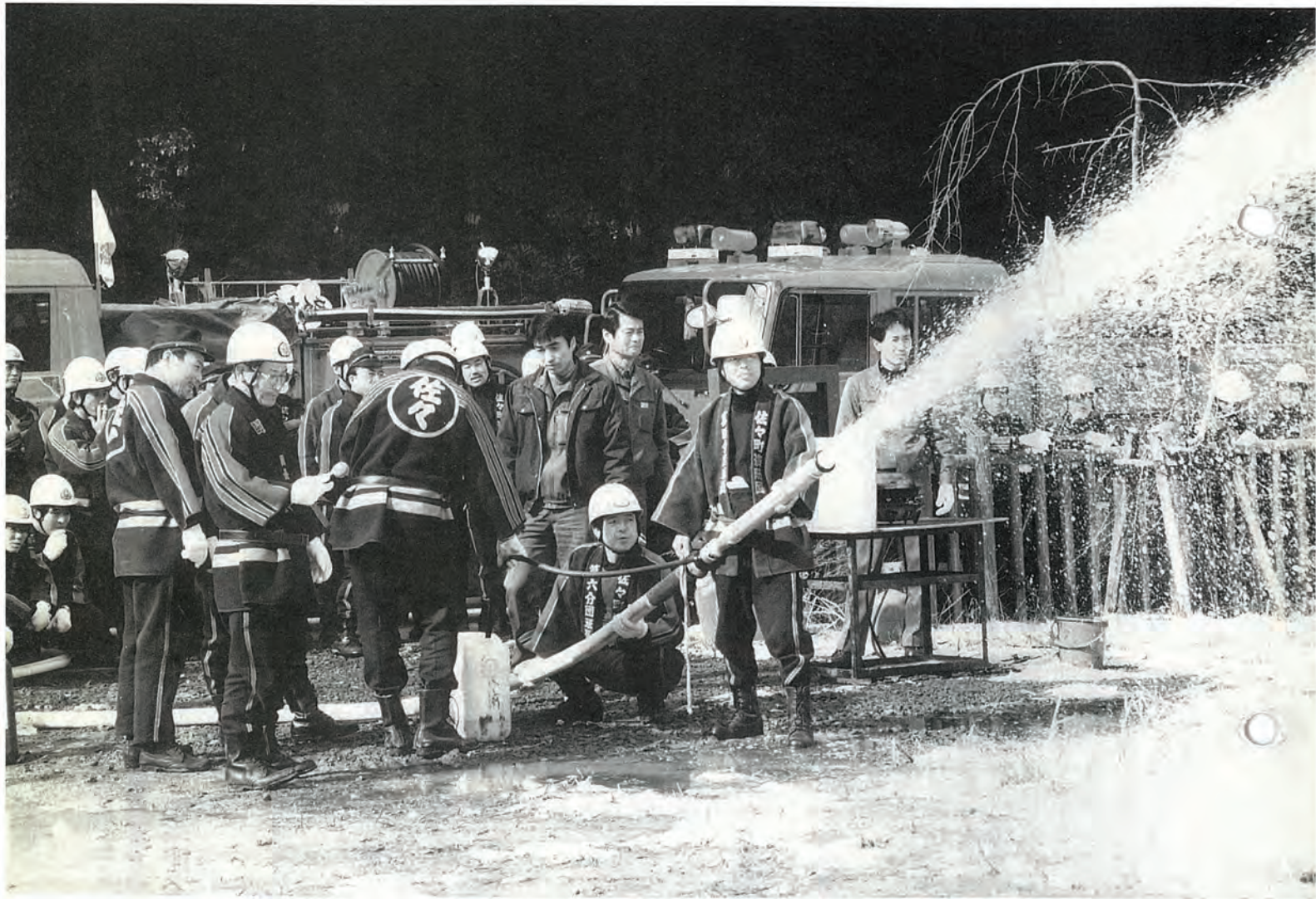
泡消火材を使った消火訓練 (3/5、消防団の火災訓練から) = 関連記事を 4 頁に掲載 =