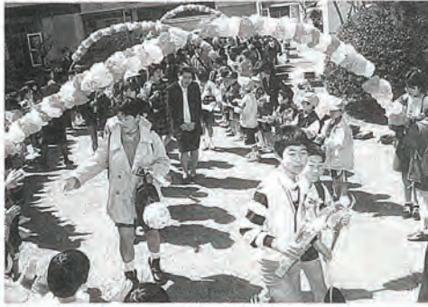
先生・在校生に見送られて

三月十六日、佐々中学校、三月二十日、佐々・口石両小学校でそれぞれ卒業式が行われ、中学生二〇八名、小学生一八八名（佐々小八七名、口石小一〇一名）が思い出多い学び舎をあとにしました。