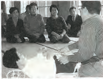
好評だった実技指導

介護の実技指導やAさんの介護体験発表、また、参加者が4グループに分かれて、日頃の介護の悩みなどについての意見交換を行いました。