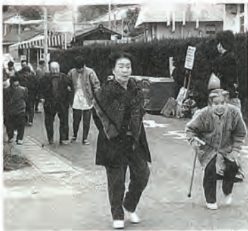
デイサービスのお年寄りも 職員の誘導で避難

三月八日、九日の両日社会福祉協議会では、老人福祉センター、生きがいと創造の家、ゲートボール場の利用者とデイサービスC型、E型の通所者を対象に避難訓練を行いました。