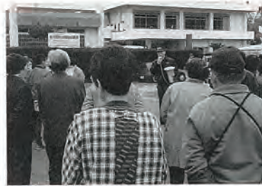
西消防署佐々出張所長のお話しを熱心に聞く参加者