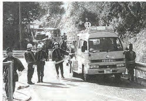
遠い水利からの中継訓練

消防団員は、それぞれに別の生業を持ちながら、火災などの災害時にはいち早くかけつけ、町民の生命・財産を守る