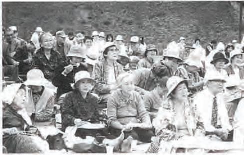
「花見弁当も楽しみよねー。」