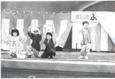
「みごとな花を咲かせましょう!!」 熱の入った寸劇

この日は、一人暮らしのお年寄り百名、町内会長、民生児童委員、福祉協力員、ボランティア他関係者など合わせて百八十名の参加があり、さ