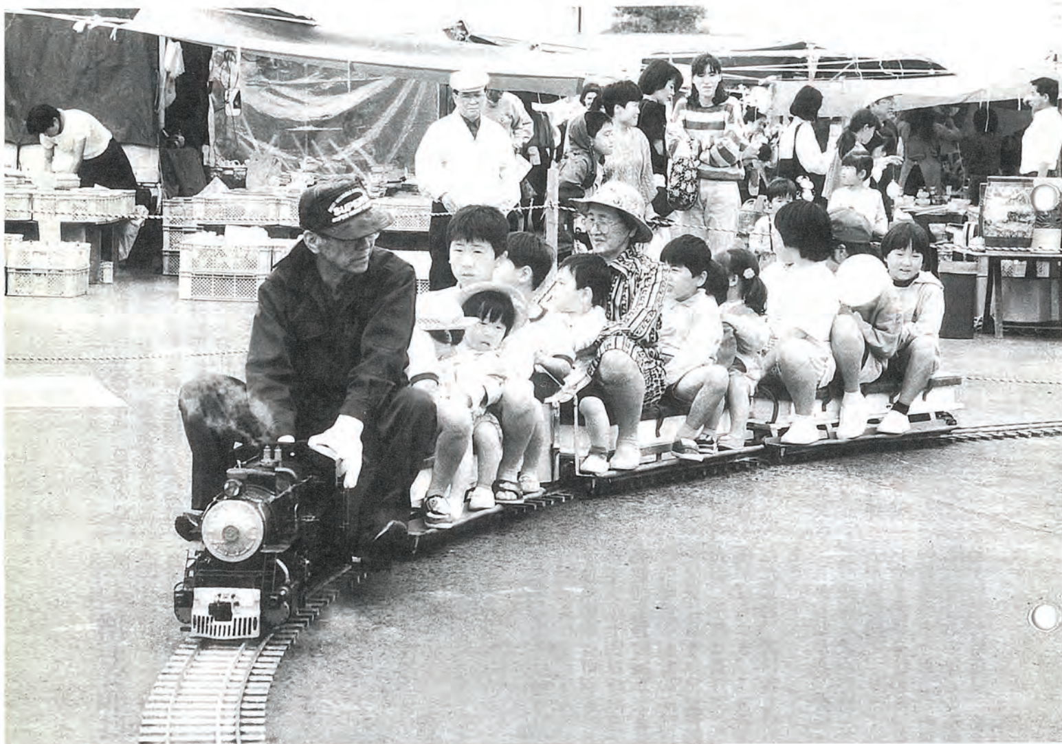
＝5月13日、佐々町春まつり会場にて＝