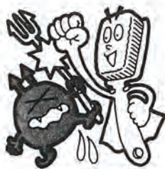
歯の衛生週間 (6月4~10日)

この歯垢を取り除くことが虫歯の予防や歯肉を守る重要なポイントです。物を食べたあと3分くらいたつと口中の細菌が歯垢をつくりはじめるといわれ、時間がたつほどネバついてきて取れにくくなります。そこで、食後なるべく早いうちに歯みがきをすることが、歯の健康に役立つというわけなのです。