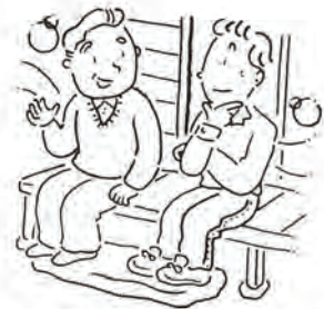
社会を明るくする運動