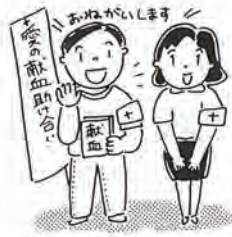
「愛の血液助け合い運動」月間