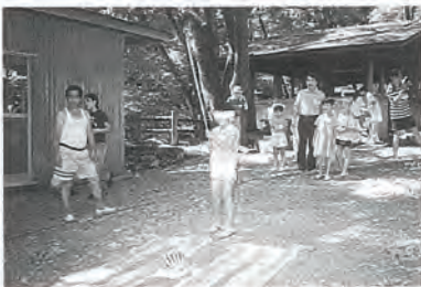
1日お父さんの民生児童委員もこどもたちから引っ張りだこ