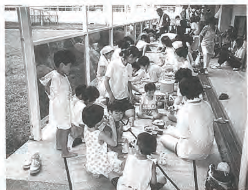
みんなで弁当を囲む楽しいひととき