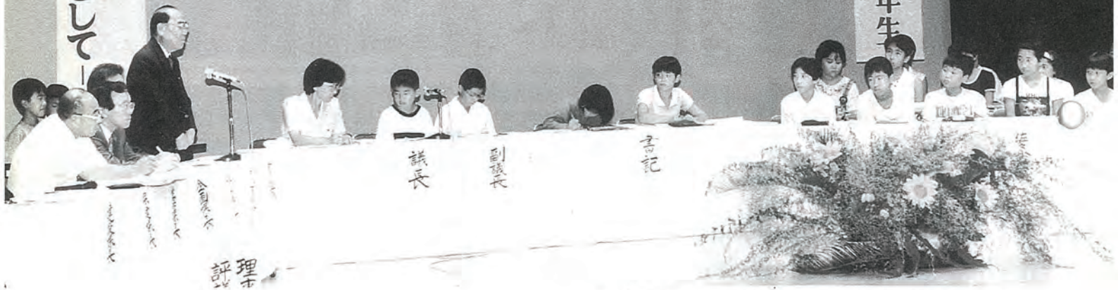
8月28日に開かれた “こども福祉議会” から