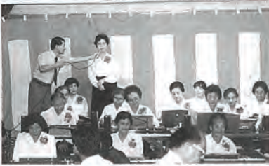
観月会に毎回参加の大正琴

新入学児童の交通事故防止に通学用の黄色帽子、小中高校にチューリップの球根の贈呈、若年母子父子家庭のふれあい交流事業、また、福祉協力員などの地域ボランティア活動の推進など多くの福祉事業に生かされています。今年度もどうぞよろしくお願ひ申し上げます。