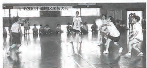
熱戦が続いたミニバレーボールの試合