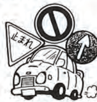
全国道路標識週間 (10月1～7日)