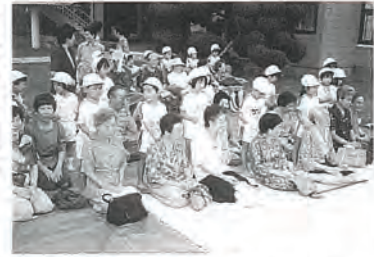
第1保育所園児の肩もみサービスで笑顔のお年寄り