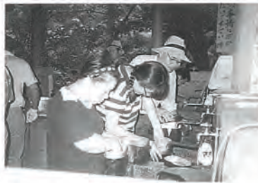
「水加減、火加減が大事よ!」50年前を思い出して飯ごう炊はん