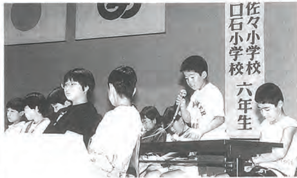
佐々小学校 口石小学校 六年生

佐々、口石両小学校六年生三十七人が一日議員となり、模擬議会を行う「こども福祉議会」が八月二十八日、文化会館で開かれ、約五百名が傍聴に訪れました。