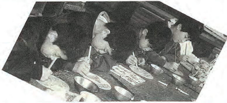
卒業記念にとお年寄りへ贈る絵皿製作に取り組む六年生