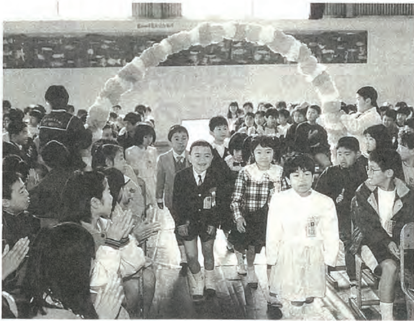
お兄さん、お姉さんたちの温かい歓迎を受けました