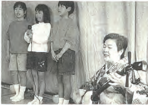
グリーンホームのお年寄りとふれあい交流

三月末日、世知原町の養護老人ホーム「グリーンホーム」に三味線の清成先生と民謡教室の児童、それに北松南高校JRC部員、社協職員の名が訪問し、入所のお年寄り方とふれあい交流活動を行いました。