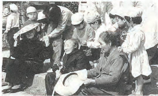
おばあちゃん 気持ちいい?