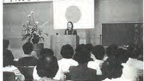
平成6年度地域婦人会総会

さて銅像の件だが、建立の日は記憶にないけれども、完全武装の粟々しい立像が、現在の三柱神社の前庭の、東端に在った忠魂碑の横に建ち、遠近から参拝に来る人も多く佐々の名所の一つとなっていた。