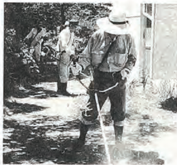
△草刈作業も積極的

町社協福祉協力校の佐々小學校三年生が、校区内のねたきりのお年寄りへ渡して下さいとミニ笹飾りに手紙を添えて社協へ届けられました。さっそく、社協事務局からお年寄り宅を訪問してお見舞の七夕を届け、たいへん喜ばれました。