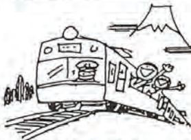
家族も安心 「安全で明るい出かせぎ」 は協会加入から