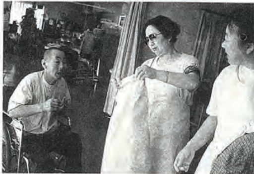
▷ゴムの入り具合は、これでどうでしょうか