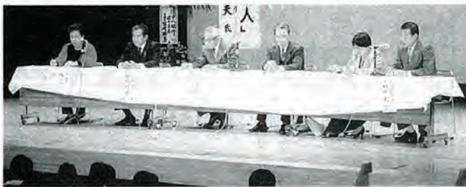
「佐々町のこれからの福祉を考えた」各代表者による パネルディスカッション