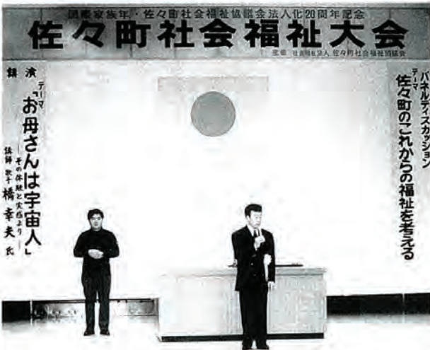
佐々町のこれからの福祉を考えた パネルディスカッション

これからの福祉について、 民生児童委員、高齢者、町内 会、福祉関係、行政の代表者 によるパネルディスカッション が行われ、続いて、歌手の