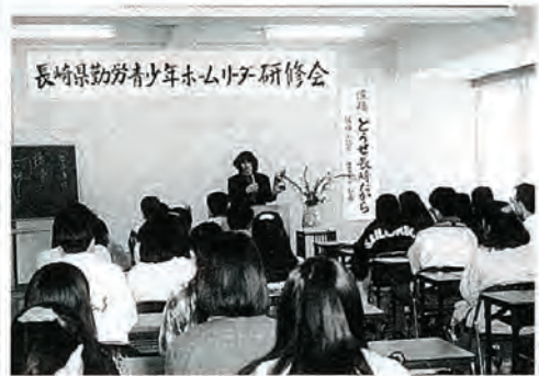
長崎県勤労青少年ホームリーダー研修会

十一月二十日(日)佐々町を会場として、勤労青少年ホームを利用する県下六ホームの働く青少年のリーダー六十余名が集まり、リーダー育成研修会が開催されました。これは、毎年実施されている研修会ですが、リーダーと