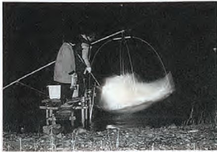
「夜のしらうお取り」