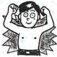
成人病予防週間 (2月1～7日)