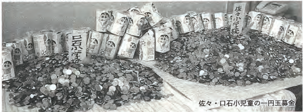
佐々・口石小児童の一円玉募金

これまで町社会福祉協議会をご支援いただきました関係者の皆さまをはじめ、町民の方々へ厚くお礼を申し上げます。