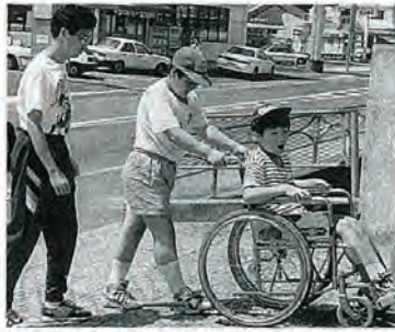
坂道は後ろ向きでゆっくりと