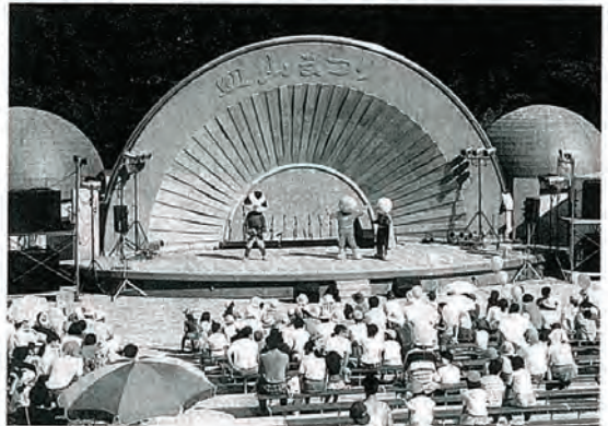
アンパンマンの登場に子どもたちは大喜び

このあとも、〇×ゲームやヨーヨー釣り大会など盛りだくさんのゲームにちびっ子たちが歓声を上げ、また、ふれあい広場で開かれたアンパンマンショーを見て大喜び。夏休みの楽しい一日を過ごしました。