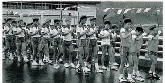
佐々小鼓笛隊のマーチに合わせて