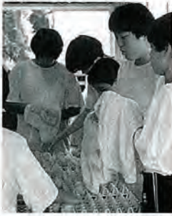
卵はそーっとふいてね