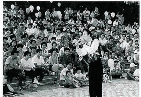
あっ！ヘリコプターが……