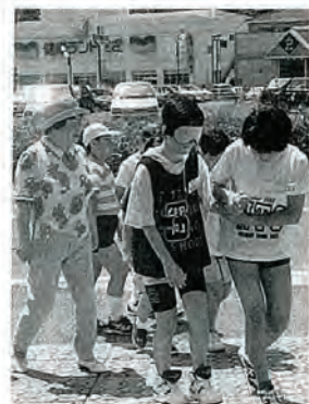
「見えないってこわいでしょ」 福祉協力員さんもつきっきりで!