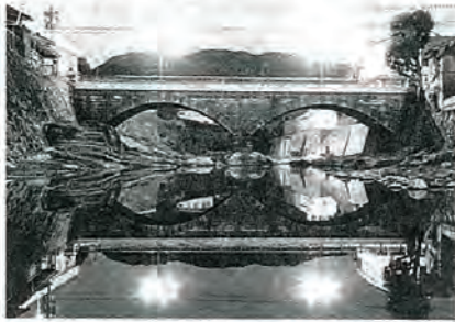
第2回、会長賞の作品 (親和銀行佐々支店に展示中)