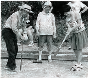
今度はうまくいかなか