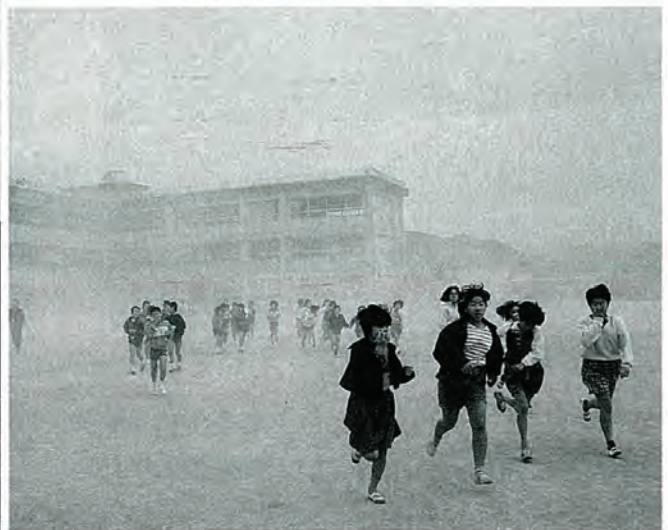
本番さながらの避難訓練 (避難する児童も真剣そのもの)