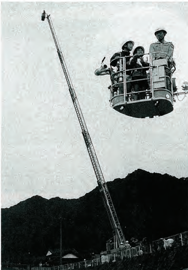
”わあ～高いなあ～” はしご車のバケットに乗って 40メートルの高さを体験!!

するため、県央・県北の市や町、佐賀県有田町、西有田町など四市、十五町、四消防本部で結ぶ消防相互応援協定に基くもので、毎年開催地を変えて訓練を実施。佐々町では昭和四十七年以来二十一年ぶりの訓練でした。