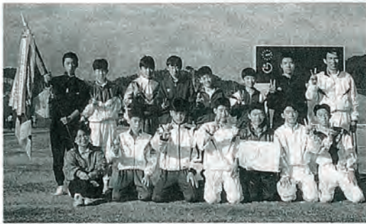
"やったぜ"とVサイン