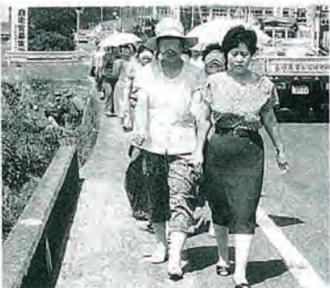
視覚障害「体験セミナー」