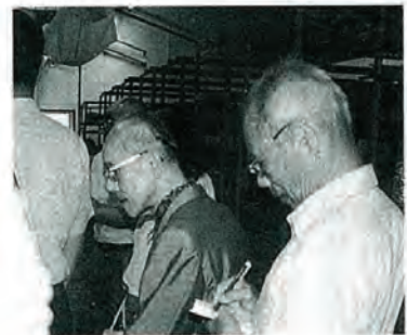
地域福祉活動計画「部会活動」