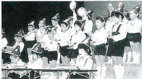
写真は保育所発表会から

※所得税の確定申告をされている方は、申告後早急に申告書の控えを税務課に持参し、所得税確定申告確認書の交付を受けて提出して下さい。