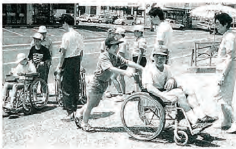
児童の福祉体験「サマースクール」