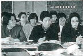
地域のアンテナ役 「福祉協力員 47名誕生」