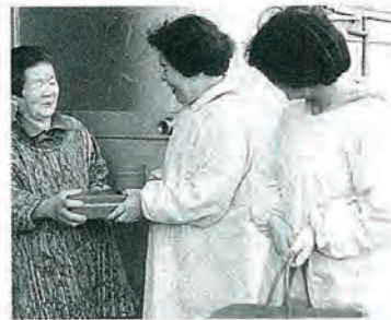
待ち望んでいた「福祉給食」開始