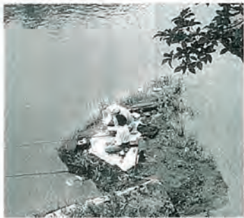
会長賞の作品「楽しい釣り場」