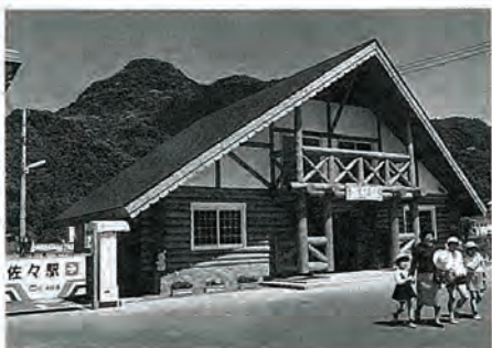
写真展が行われている 佐々駅舎

吉井町、世知原町、佐々町 及び小佐々町の四か町合同に よる、ログハウスをテーマと した写真展を開催いたしてお ります。 通勤通学の途中やお買物帰 りに、気軽にお立ち寄り下さ るようご案内いたします。 ◎開催期間 四月十二日(日)まで (午前八時～午後六時) ◎開催場所 松浦鉄道佐々駅舎内 ギャラリーにて