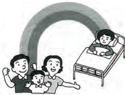
骨髄バンクを応援して下さい。

患者の病んだ骨髄を葉などで空にして、そこに提供者(ドナー)からいただいた健康な骨髄におきかえる治療法です。つまり、一いちど緑の失われた大地に種をまき、芽を出させて再び青々とした森を望む—骨髄移植はこれに似ています。