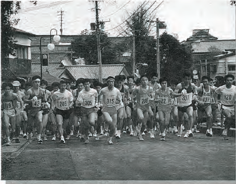
年代別に別れてスタート! 今年も県内外から多くの人が参加