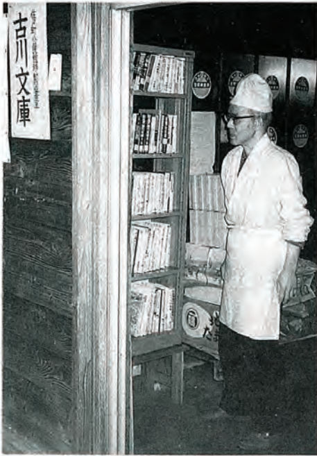
光武勇一さん宅へ設置された古川文庫（古川バス停前）

古川モデル町内会では、誰もが気軽に立ち寄れる便利な場所に「古川文庫」を設置されました。ぜひご利用を！