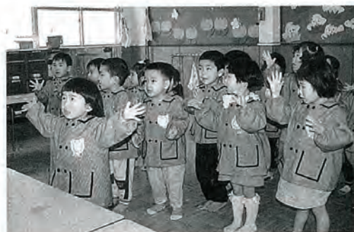
わかりましたかー “ハイ”