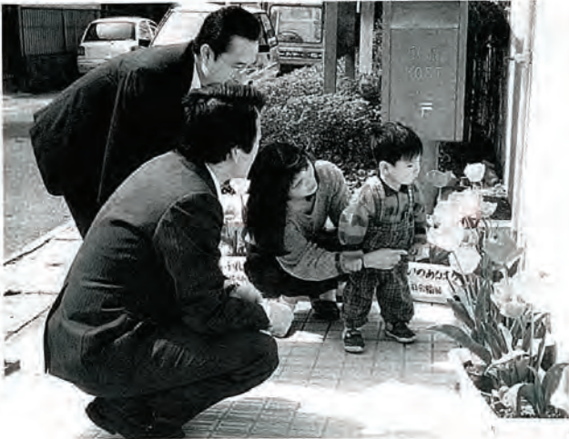
佐々郵便局に立ち寄った お客さんの足を止め

まちかどに咲いた チューリップ 二百鉢 福祉協力校の佐々小学校では、児童が大事に育てた赤や黄色のみことなチューリップを校区内のまちかどに設置して、まち行く人々のほほ笑みをさそっていました。