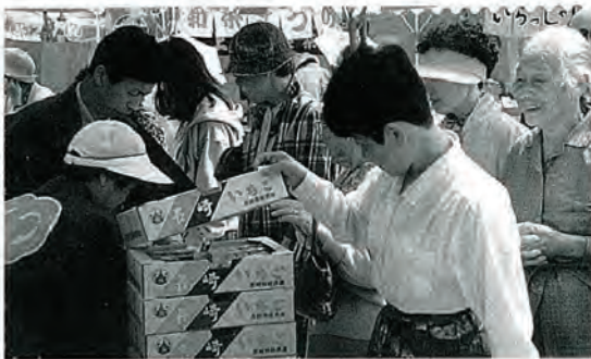
にぎわいを見せた 昨年の春祭りの様子