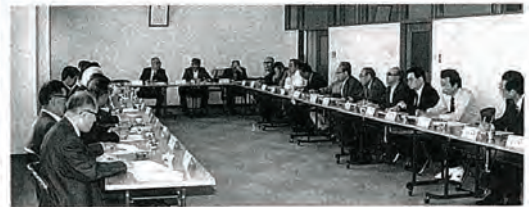
▼写真は今年度第1回目の町内会長会の様子