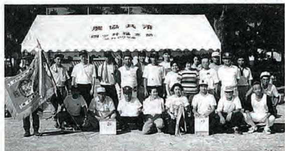
アベック優勝の四ツ井樋町内会

小浦地区四町内会（浜迎、土手迎、水道、四ツ井樋）の人たちの親睦と融和を図るため、毎年開かれている「小浦地区球技大会」が九月六日、口石小グラウンド及び南部体育館で行われ、ソフトボール（男子）、ミニバレー（女子）やゲートボール（混合）にさわやかな汗を流しました。