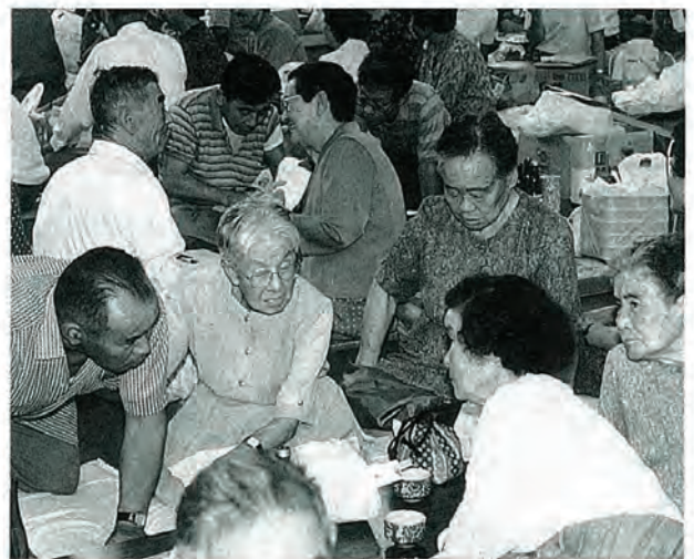
久しぶりに会って話はずみしました