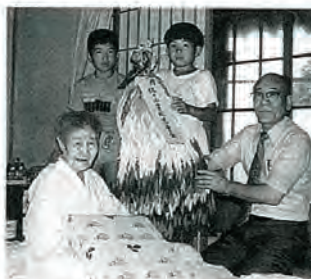
毎年お見舞いありがとう

社会福祉協議会では、ボランティア活動の一環として、九月十一日老人センターで第四回伝統芸能伝承活動(通称観月会)を開催しました。 まず佐々町の郷土に伝わる「神田雅楽」が若い人に今も伝承され、引き継がれていることを紹介。 また当日会場に参加したボランティアの皆さんは、みどり会による郷土料理で会食。俳句の吟詠や仲秋の名月もうっとりするような「男性コ