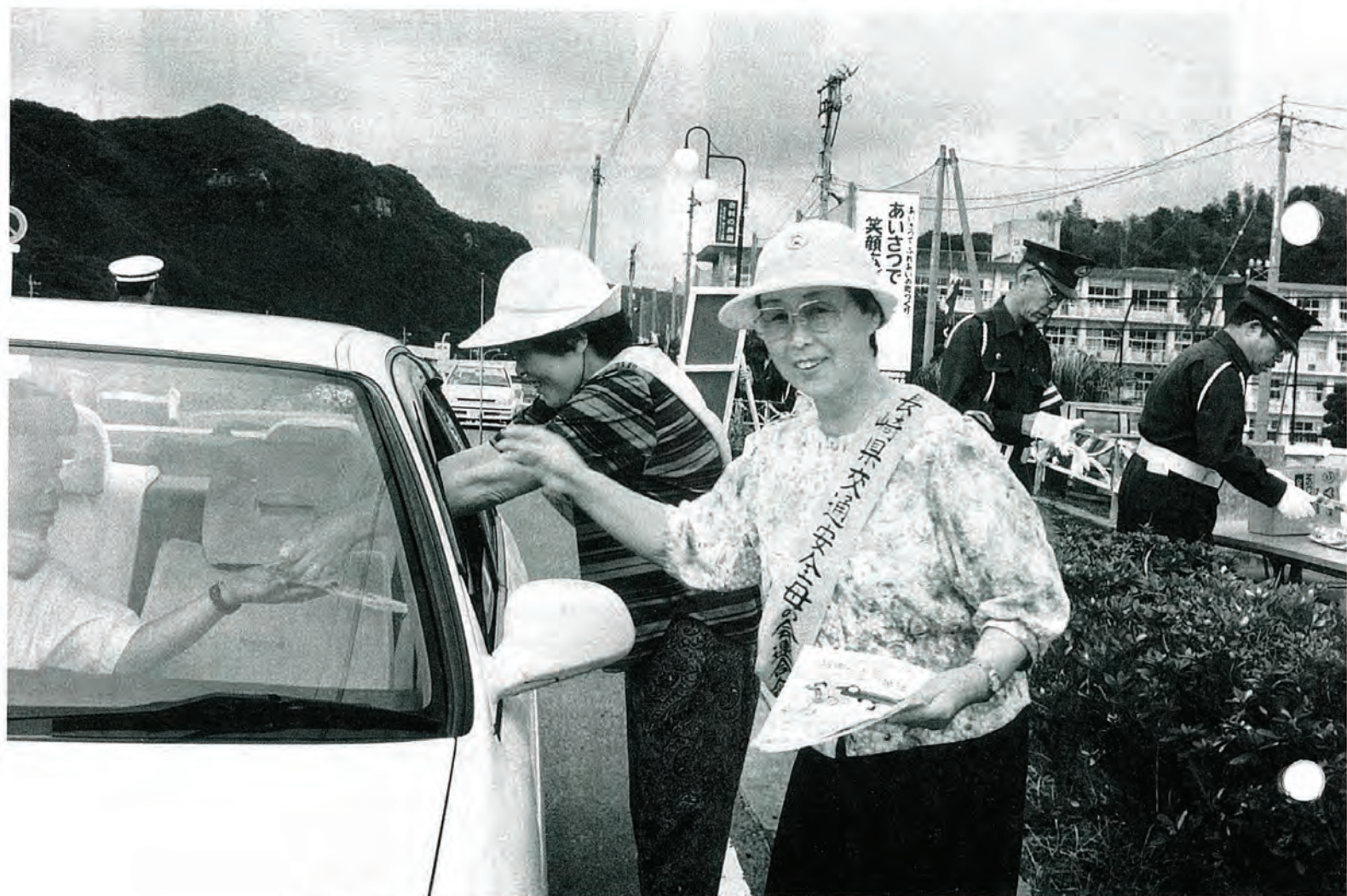
9/25 佐々町交通安全母の会の『さわやか作戦』から