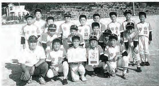
少年球技大会で優勝した市瀬チーム