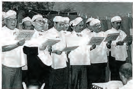
男性コーラス聴衆を魅了