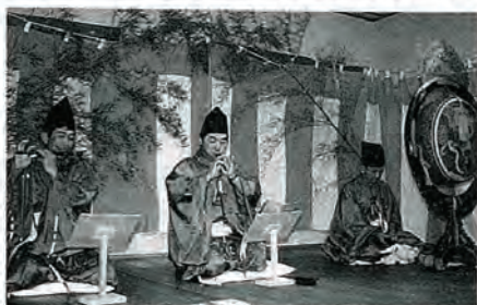
神田雅楽を奏でる保存会の方々