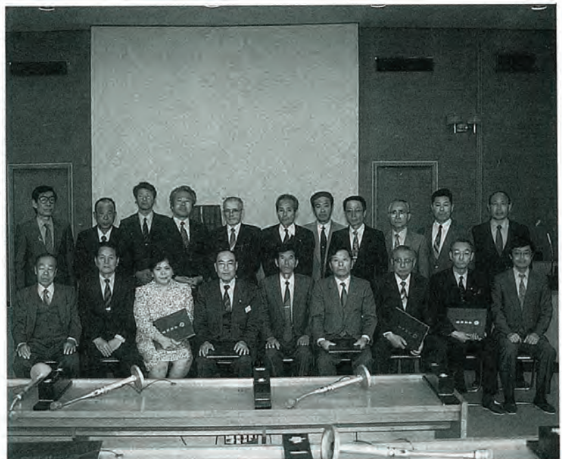
4月22日、町長および19名の議員のみなさんへ当選証書が附与されました。