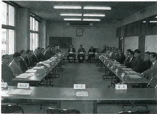
写真は、今年の町内会長さん

係のあるもの、独自の行事のお世話をはじめ、町内会からの町への要望を調整していたり、だくなど、住みよい地域づくりのため住民の