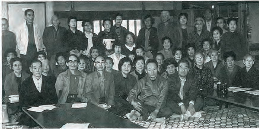
▲水道町内会老人クラブ (42名) が公民館について学習

四月十一日、明生大学講座が新年度佐々町公民館学習活動のトップをきって開講。十二日、佐々町地域婦人会の総会で「婦人の心構え」と題し講演又今後の地域婦人会の充実発展に結ぶ事業計画の承認。二十三日、佐々町公民館学習グループ連絡会(29)を結成。二十五日、佐々町婦人団体研修会では「高齢化社会と地域づくり」について研修を深めました。一方勤労青少年ホーム、学童農園もにぎわっています。