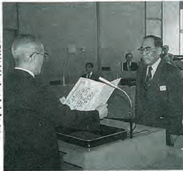
当選証書附与式にて