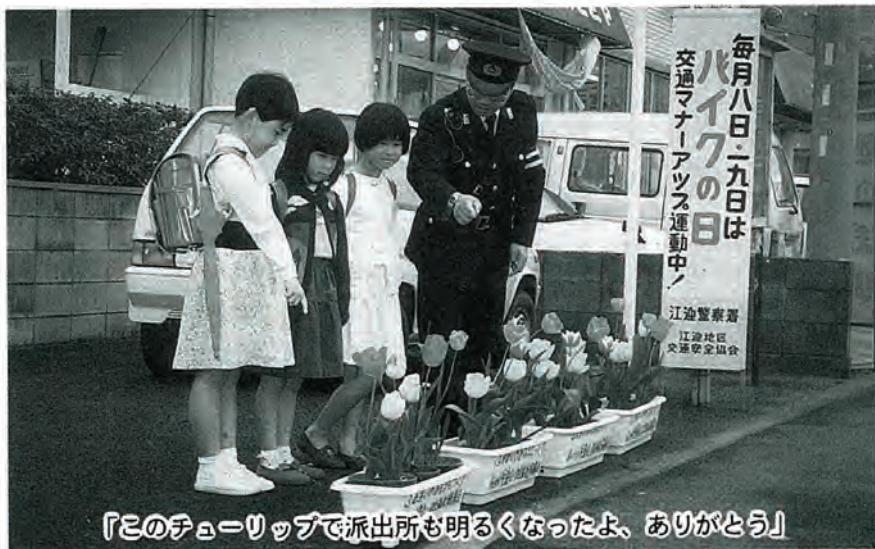
「このチューリップで派出所も明るくなったよ、ありがとう」