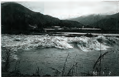
昨年7月2日の大雨による佐々川の様子