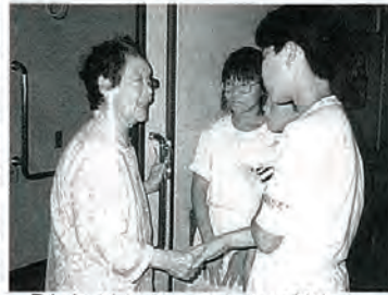
「ありがとうございます。こんなに嬉しかったことはないよ。」

ボランティア協力指定校の佐々小学校児童四名、教師一名、社協職員一名は、小佐々町高齢者コミュニティセンターで開催された北松プロジェクトで開催された北松プロジェクトワークキャンプ(郡内十九の小中高校生と教師、社会福祉協議会職員、参加者計百三十名)に参加しました。研修施設の特養老人ホーム