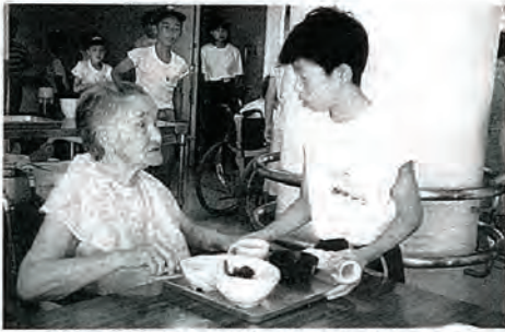
「きょうはおかげでおいしかった」