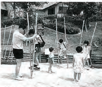
どんぐり村で楽しかったばい