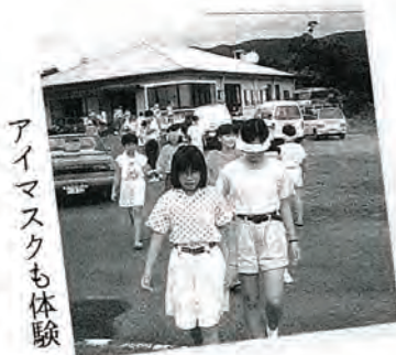
アイマスクも体験