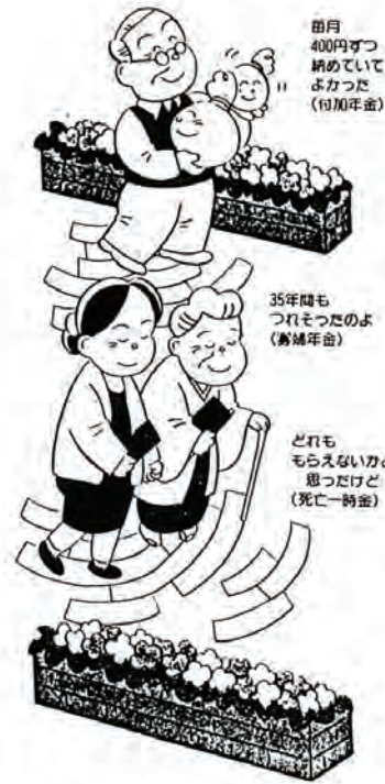
毎月400円ずつ納めていたよごれ (付加年金)