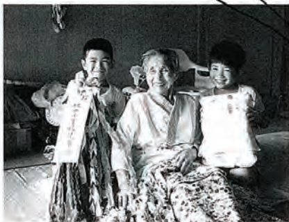
敬老見舞い 毎年ありがとう