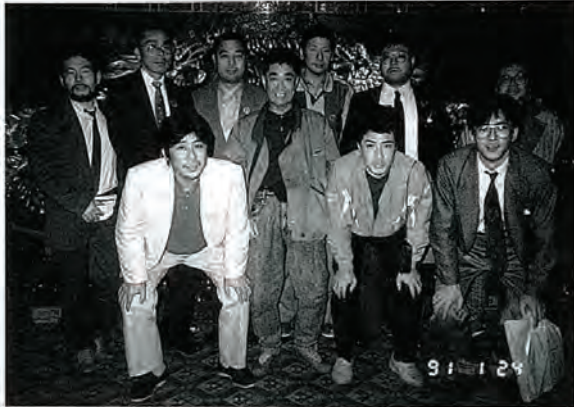
アバディーン水上レストラン 「TUMBO」内にて(香港)

本町では、ふるさと創生事業により「心のふれあう活力あるまちづくり基金」を設けて、①人材育成 ②文化、産業振興 ③イベント、フォーラム等の助成を行っています。 平成二年度においては、人材育成事業三件(一、〇七二千円)について助成をいたしました。 中国研修・香港・シンガポール研修・東京市場研修研修を終えられた方々は、各々に有意義な旅行であったようです。 手続きは簡単ですので、利用してみたいかがですか?