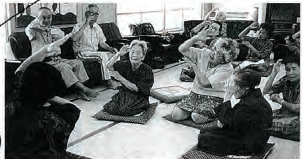
ボランティアによるデイサービスで楽しい手踊り