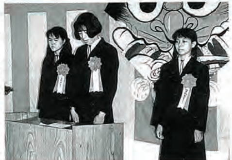
平戸税務署員に対し、訓辞を行う受賞者

てどれくらいいるのでしょうか。自分から理解しようと思わず、文句をつけて、事に触れようともしないならば、そこにどんな素晴らしいものがつまっているのも私達にどれほど幸福を与えてくれるのかをわからずじまいになってしまふのです。