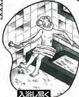
入浴し易く 洗い場からの浴槽の高さは 35～45cm程に。