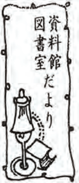
資料館だより 図書室

暖かい日ざしがさしかかり、野や山の草花も芽を出し早春のときめきを告げる三月、手足を大いに伸ばして散歩に出かけるのもいいですね。