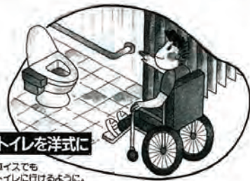
トイレを洋式に 車イスでも トイレに行けるように。