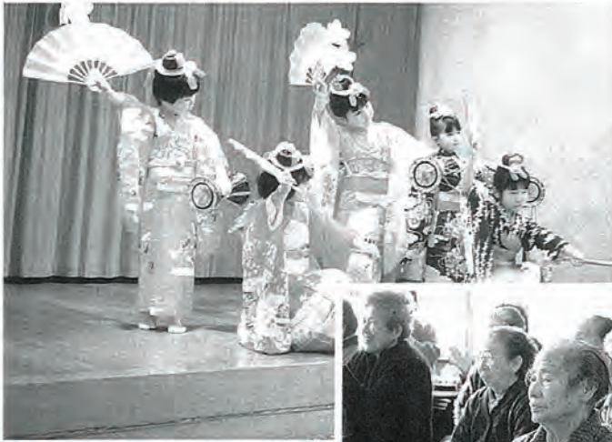
▲園児たちのかわいしぐさにお年寄りたちの盛んな拍手が