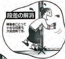
段差の解消 障害者にとって 小さな段差も 大変危険です。