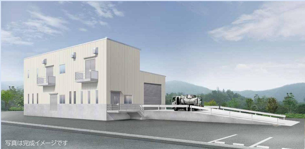
写真は完成イメージです

建設工事中は工事看板等を設置し、交通誘導員配置による一般の通行人および車両の安全確保に努めます。近隣住民の皆さまには大変ご迷惑をおかけいたしますが、ご理解とご協力をよろしくお願いいたします。