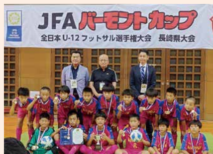
□石フットボールクラブの皆さん