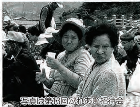
写真は第13回ふれあい招待会

社会福祉協議会は毎年四月にひとり暮らし老人とボランティアによる演芸でのふれあい招待会を、今年も平戸つづじや八重桜の花吹雪が舞う皿山公園で開催しました。