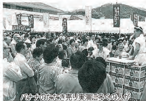
バナナのたたき売り実演に多くの人が

また金魚すくい、ファミコンゲームコーナーでは、たくさんの子供達の姿が目につきました。家族連れで気軽に楽しめる春まつり、また来年のご来場をお待ちしております。