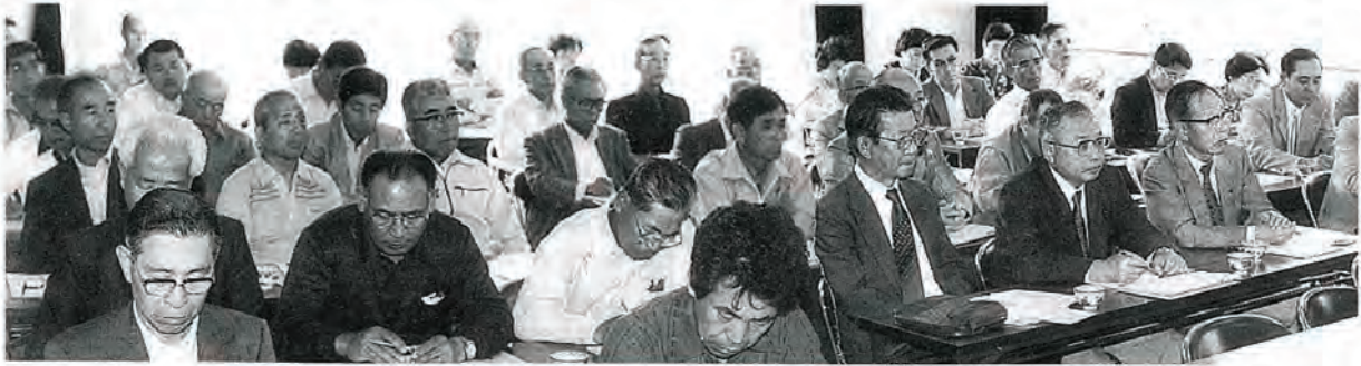
「公民館はどうしてなくてはならないか」(研究を深める館長役員さん)

地域に出かける移動公民館をはじめから数年になりますが、若い人から年配の人まで「また来年も、うちの町内会に来てください。」また地域への講座の「出前」は出来ませんか?など、講座の要望も高まっています。