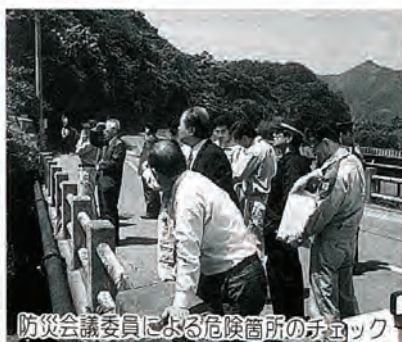
防災会議委員による危険箇所のチェック

○がけから濁ったわき水。これらは一般的なものです。異常を感じたら、すばやく避難して下さい。前もって安全な避難経路や場所を考え、家族全員で話し合っておきましょう。