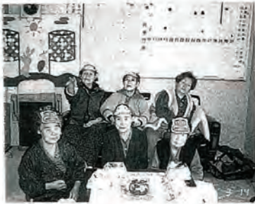
写真は楽しかった 節分の豆まきより