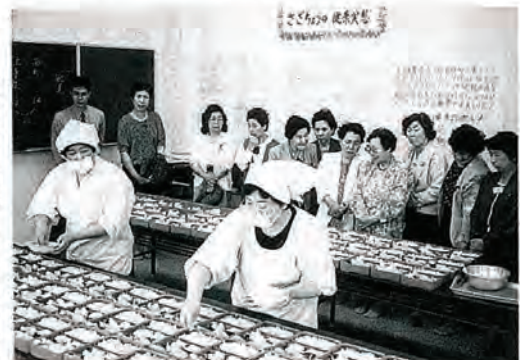
会食弁当の盛り付けを視 察されている生月町のボラ ンティアの皆さん