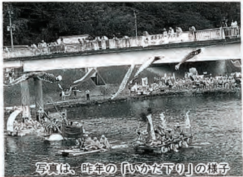
写真は、昨年の「いかだ下り」の様子

大会は、佐々あどべんちやあクラブで運営しますが、この運営スタッフも募集しています。また、この大会は佐々町青年5団体(商工会青年部、役