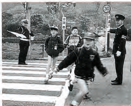
写真は、春の交通安全 運動期間中の街頭指導

この死亡事故の内容をみま すと、高校生を含む若者の無 謀運転による事故が急増して おり、特にスピードの出し過 ぎによる死者が37%を占め、 前年と比べ56%もの増となつ