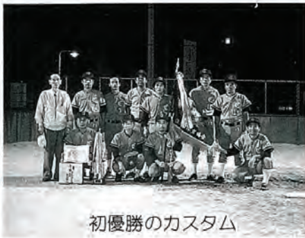
初優勝のカスタム