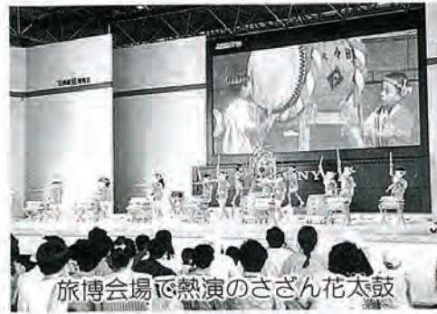
旅博会場で熱演のさざん花太鼓

先月開幕した旅博において各市町村が出し物を披露する市町村デーに、八月四日、我が佐々町からは、町立保育所の園児が出演、メイン会場での力強い太鼓演奏は素晴らしく、観客から大きな拍手を浴び、好評を博しました。また八月三日から四日間、茶業振興会の協力により、佐々茶の展示即売も行なわれました。皆さん暑い中、有難うございました。