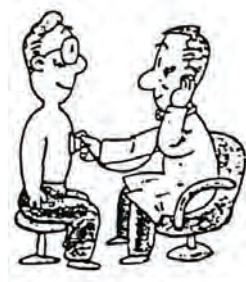
早期発見 早期治療

5、対象者 30才以上の佐々町国保の被保険者（但し、国保加入期間が6ヶ月以上の人）。昭和63年度、平成元年度受診者も申し込みできます。