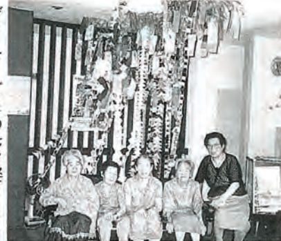
デイ・サービスの七夕祭りより