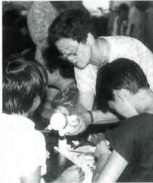
～写真は、小間もの手芸に取り組む「夏休み親子ふれあい講座」スナップから～