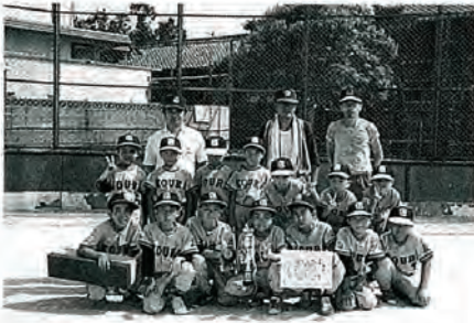
優勝した土手迎・浜迎子供会