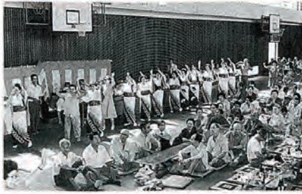
写真は昨年の敬老祝賀会の様子