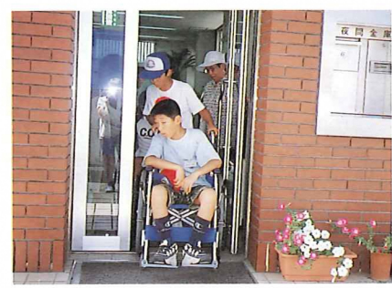
▲出入口の幅を点検