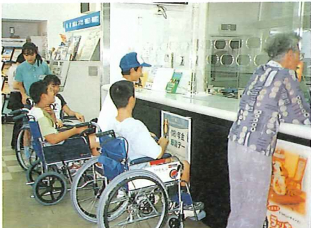
▲カウンターの高さを確認

介が出来るようにと熱心に取り組みました。 また今年度は、神田にある老人保健施設「さざ・煌きの里」や特別養護老人ホーム「虹の里」を訪問し、施設の高齢者の方々と一緒に歌や踊りで楽しく交流したり、車いす介助による散歩、おしぼりたたみなど初めてのボランティア活動を体験しました。