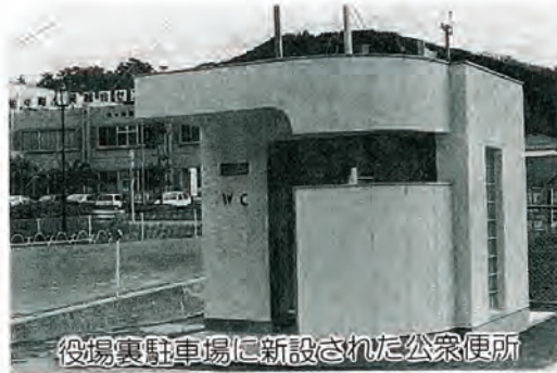
役場裏駐車場に新設された公衆便所