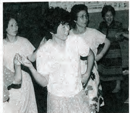
水道町内会公民館婦人学級