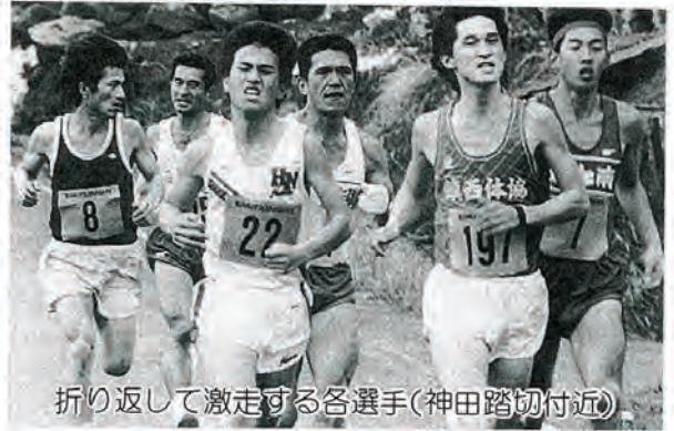
折り返して激走する各選手(神田踏切付近)