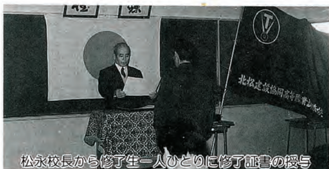
松永校長から修了生一人ひとりに修了証書の授与

三月二十二日午 後五時三十分から 第十三回目を迎え た修了式が技能訓 練センターで行な われました。 修了生は九名で、 一年間の訓練をう けたあと、技能士 補の資格が与えら れます。 修了生の皆さん の今後の社会での ご活躍を期待いた します。