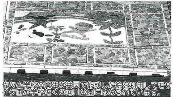
佐々小学校卒業生が共同で作成した絵を利用してモザイク画が学校近くの河川公園にはめられています。