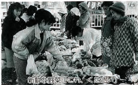
新鮮な野菜「これ、ください」