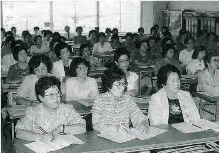
地域を盛り上げる婦人学級

読書講座をはじめ、たくさんの公民館教室・講座、公民館自主クラブ等の創作活動から趣味活動など、仲間づくり、生きがいづくりとして用意されています。