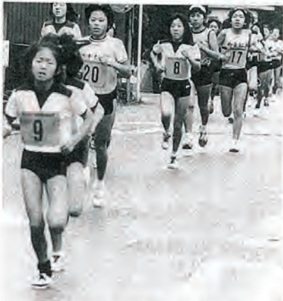
一路折り返しを目ざして