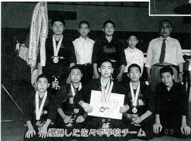
優勝した佐々中学校チーム