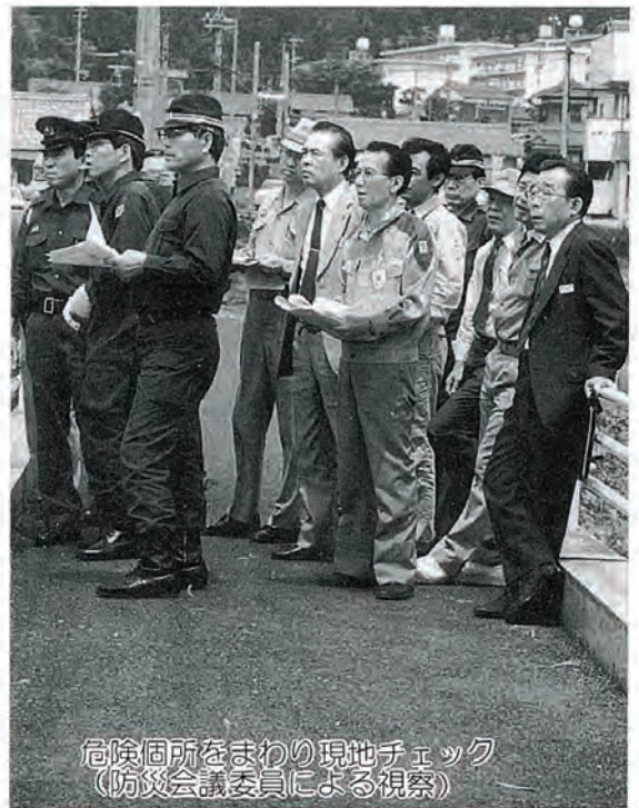
危険箇所をまわり現地チェック (防災会議委員による視察)

ったり、水位が変化。 ○がけから小石が落下。 ○がけに亀裂やふくらみ。 ○がけから濁ったわき水。 これらは一般的なものです。異常を感じたら、すばやく避難して下さい。 雨が激しく降り出してから、慌てて避難する道や場所を考えるのは駄目。前もって、安全な避難経路や場所を考え、家族全員で話し合っておきましょう。