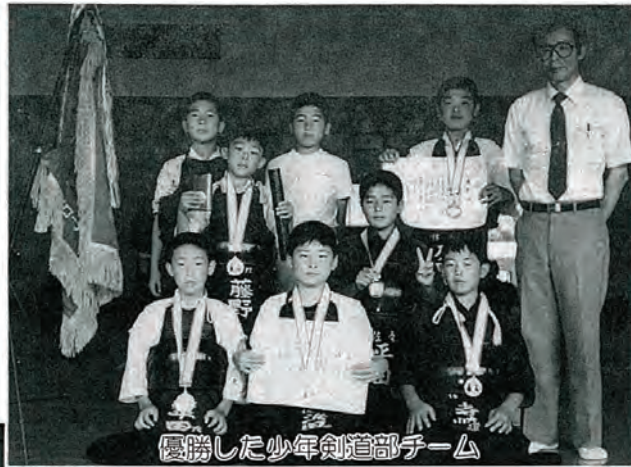
優勝した少年剣道部チーム