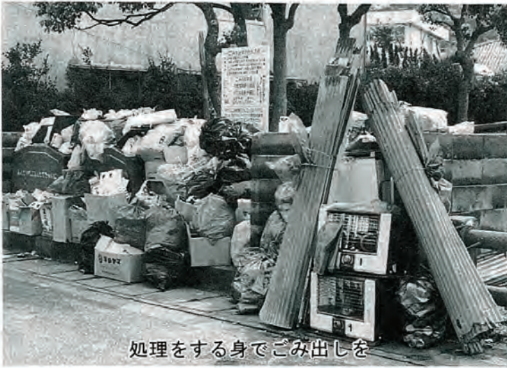
処理をする身でゴミ出しを