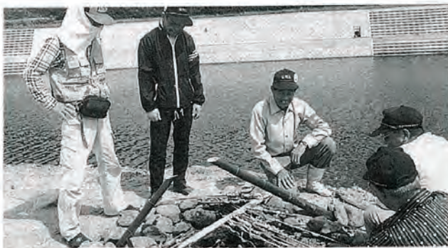
釣のあとのこのひととき 佐々川でささをくむ