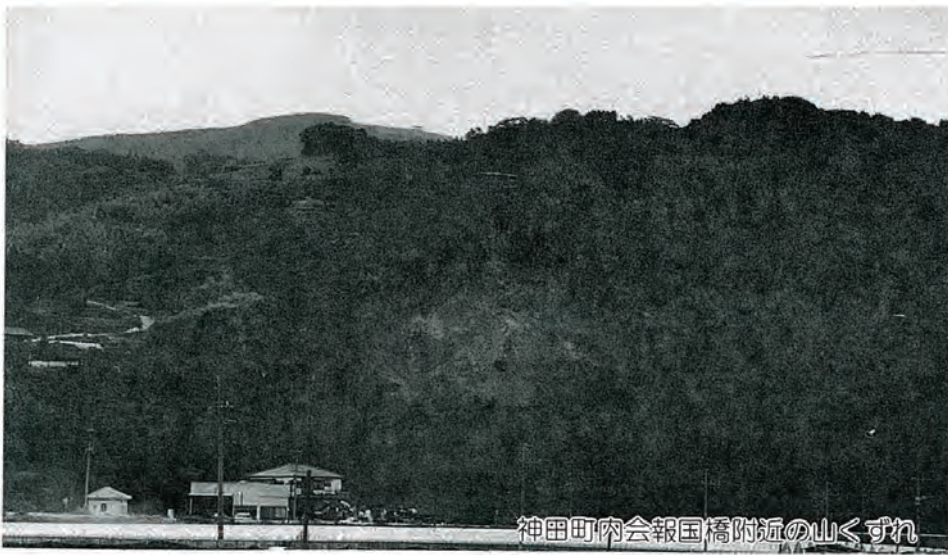
神田町内会報国橋附近の山くずれ