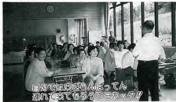
自分では来さらんばってん連れて来てもらうてヨクッタ!!

であります。社会福祉協議会からの「愛の手」をさしのべられているみなさんは、感謝の心で協力されんことを望んでやみません