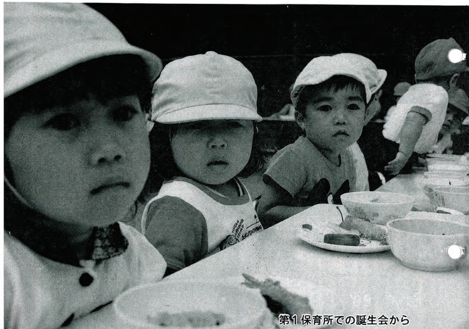
第1 保育所での誕生日会から