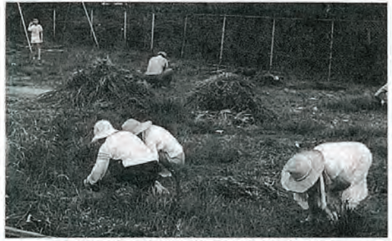
新町町内会(豎山住宅)の公園清掃