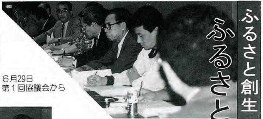
6月29日 第1回協議会から

一億円の市町村への交付が決まり、佐々町でも、将来を見つめながら、どうしていくか、話し合われています。 住民の皆さんから、寄せられたアイデアは、先月号で一六〇通ということをお知らせしましたが、今回は、その種類についてお知らせします。八種類に大別してあります。次のとおりとなっています。