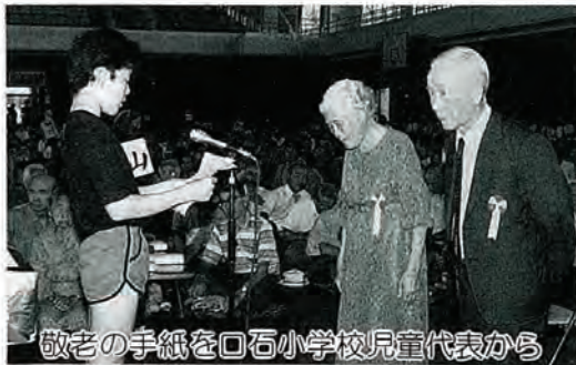
敬老の手紙を口石小学校児童代表から

式では、町から敬老年金の支給と米寿、九十歳以上の方々へそれぞれ記念品が贈られました。