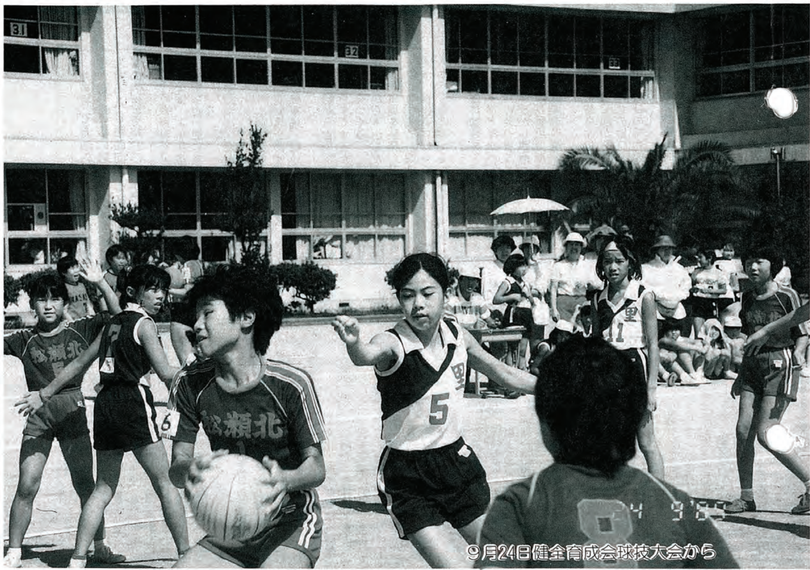
9月24日健全育成会球技大会から