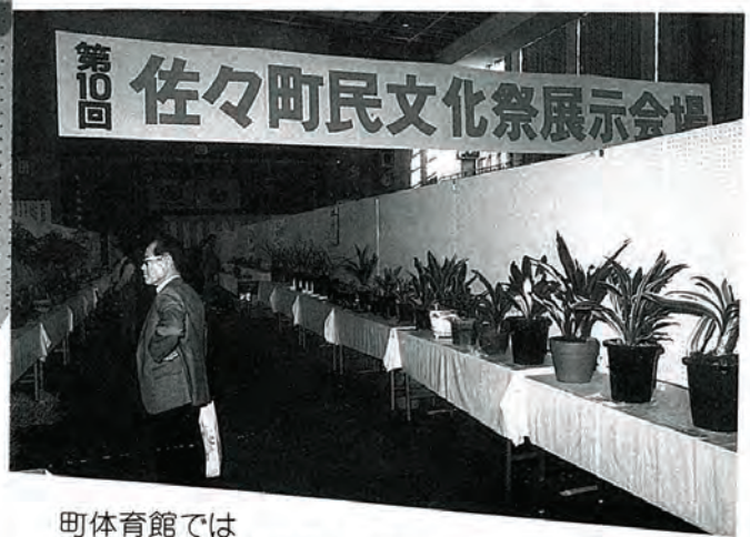
町体育館ではみごとな作品が展示された