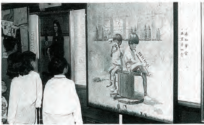
洋画の部で県知事賞・西望平和賞に輝いた「夏のしらべ」

第三十四回県展の移動展が十月二十日から二十二日まで佐々町民体育館で展示されました。県展出点数は、史上最高の二、〇六六点でした。今回は、その中から町内出点など一三〇点が展示されました。