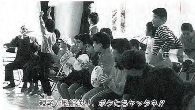
親子で風船送り、ボクたちヤツタネ!!

階で、ねずみの相撲人形劇(劇団「かん」)を見たり、宝くじゲームなどをしました。また、ボランティアアすみれ会々員のみなさんによるシチユーに舌づつみ。「日曜日もなかなか子供と一緒に遊んでやる暇がなくて」と参加されたお父さんやお母さん方もこの日ばかりは、子供さん達に混じって楽しそうでした。