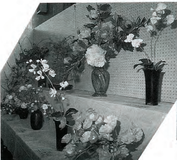
生花と見間違える出来ばえ