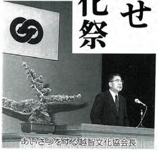
あいさつをする越智文化協会長