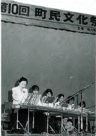
勤青琴クラブの演奏