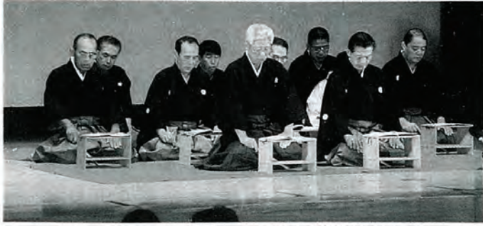
佐々謡曲会による「鶴亀」発表

芸能は年々凄み、深みの魅力を増し、作品展示は力強く、見事な書、編物、フラワー、藤手芸など人間が造り上げた作品に来訪者はうっとり見入っていました。