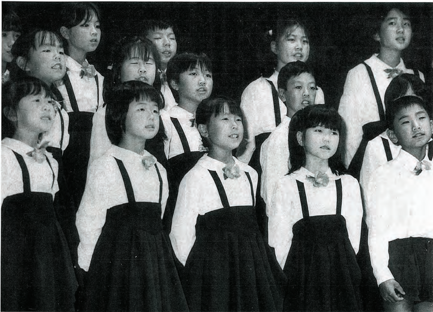
(佐々町少年少女合唱団の児童のみなさん)