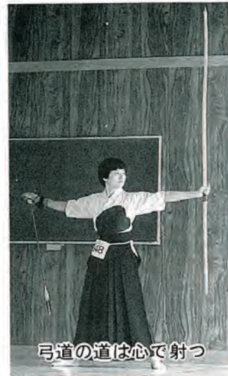
弓道の道は心で射つ

千本公園弓道場(自修館)でお待ちしております。詳しいお問い合わせは、PR担当 拙(みかづき商店)まで。 夜 8 空 1 三 三