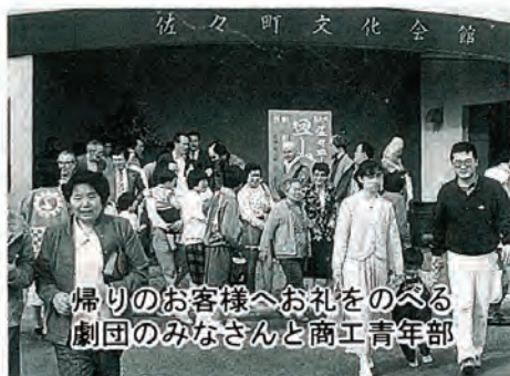
帰りのお客様へお礼をのべる劇団のみなさんと商工青年部

ホームステイをしながら手づくりで仕上げたもの。一つの劇を、製作者と地元が協力して仕上げたところに意味があると思います。