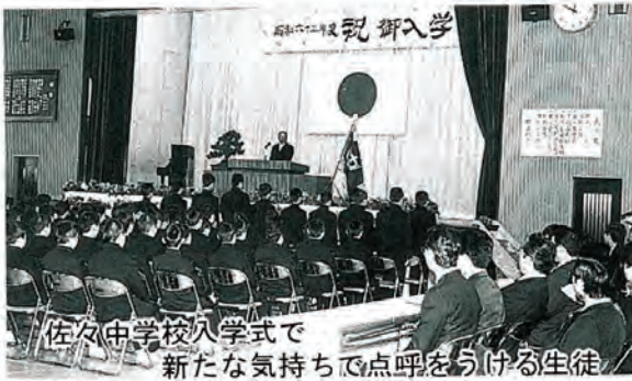
佐々中学校入学式で 新たな気持ちで点呼を受ける生徒

物から心へと変化しはじめた今日、時代をリードする趣味の二面性があなたの心を捉えます。