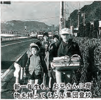
新一年生も、お兄さんに荷物を持ってもらい集団登校

四月七日、佐々中学校入学式、四月八日、口石小、佐々小学校がそれぞれありました。中学生は総数二〇一名、小学校では、口石小一〇九名、佐々小七二名が入学。