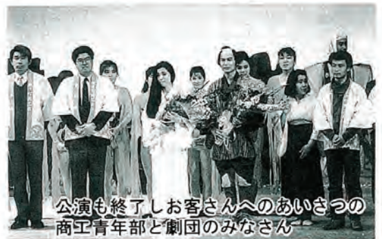
公演も終了しお客さんへのあいさつの商工青年部と劇団のみなさん