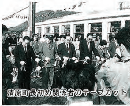
清原町長初め関係者のテープカット