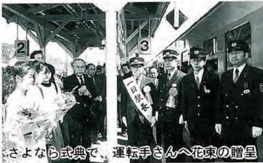
さよなら式典で、運転手さんへ花束の贈呈

参加者は、記念乗車として江迎鹿町駅へ佐々間を往復し初乗りされ、ご満悦の様子でした。 みなさんの足としての利用をお願いします。