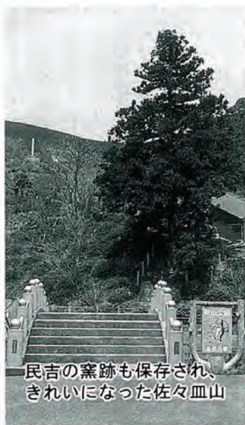
民吉の窯跡も保存され、きれいになった佐々皿山

ホームステイをしながら手づくりで仕上げたもの。一つの劇を、製作者と地元が協力して仕上げたところに意味があると思います。