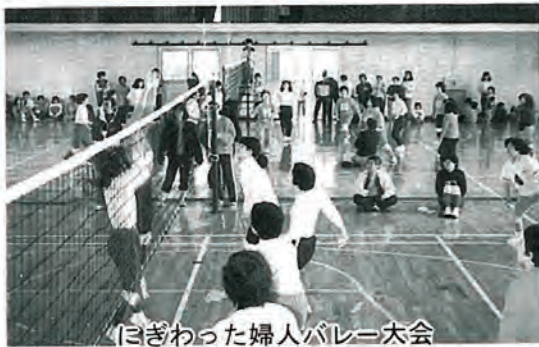
はぎわった婦人バレー大会