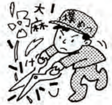
不正大麻・けし撲滅運動 (5月1日~6月30日)