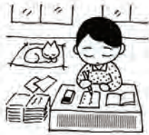
家内労働旬間 (5月21日~31日)