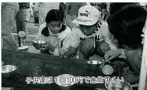
子供達は1回100円で金魚すくい