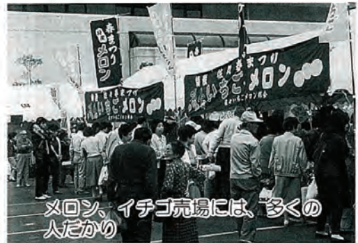
メロン、イチゴ売場には、多くの人がたかり