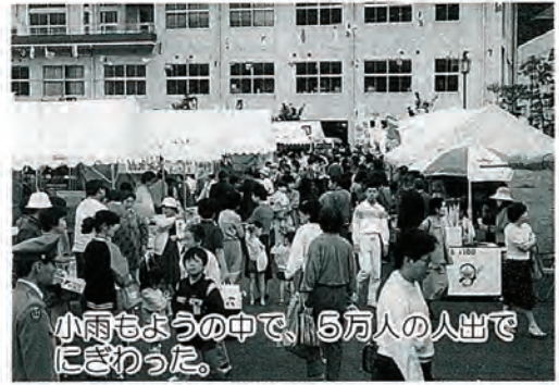
小雨もようの中で、5万人の人出でにぎわった。

第十一回佐々町春まつり（佐々町観光協会主催）が、五月十四日、十五日の両日、佐々町文化会館前広場で、佐々町特産のイチゴ、メロン、お茶などが出店され盛大に開催されました。第一日目、午前十時打ち上げ花火を合図に開会されました。主催者を代表して、藤島観光協会会長があいさつ、小雨のふる中町内外からの買い物客でにぎわいました。