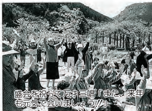
盛会を祝って万才三唱「また、来年も元気で会いましょう!!」