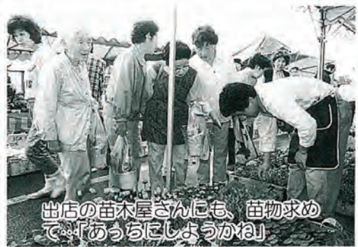
出店の苗木屋さんにも、苗物求めて「あっちにしようかね」

「来年は、こうした方がよい」といったご意見をお聞かせください。なお、二日間にわたりご協力をいただきました、警察官、交通指導員のみなさんをはじめ、各関係事業所の方々に、紙面をもちまして厚くお礼申しあげます。