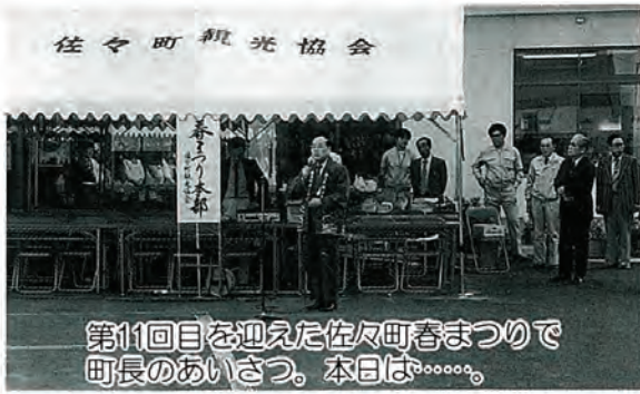
第11回目を迎えた佐々町春まつりで町長のあいさつ。本日は.....。

出店は、八〇店舗で、事務局の調べでは三万人の人出があったとか。祭りと言えば、やはり子供達が楽しみにしているもの。金魚すくいのお店、小物売場、バザーのたべもの食堂では、たくさんの子供達の姿が目につきました。また、メロン、イチゴ売場では、最良の品を買い求め、宅配便会場へ。遠くにいる家族、友人などへ品物を送るお客さんで宅配会場は大忙しの様子でした。