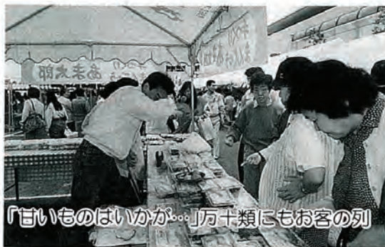
「よいものはいかが...」万十類にもお客の列

「来年は、こうした方がよい」といったご意見をお聞かせください。なお、二日間にわたりご協力をいただきました、警察官、交通指導員のみなさんをはじめ、各関係事業所の方々に、紙面をもちまして厚くお礼申しあげます。