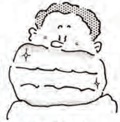
歯の衛生週間 (6月4日～10日)