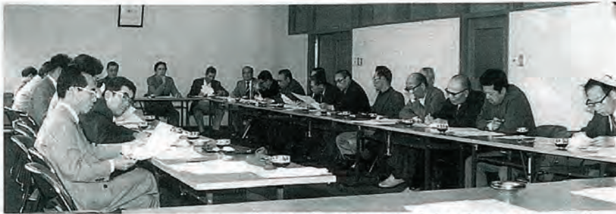
町のお願いで、年2～3回行なわれる町内会長会(4月28日スナップ)

町内会長さん方の集まりの中で、六十三年度の新役員さんが、四月二十八日に決まりましたのでご紹介します。