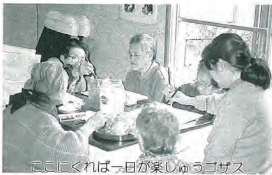
ここにすれば一日が楽しゆうゴザス