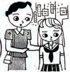
青少年を非行からまもる 全国強調月間