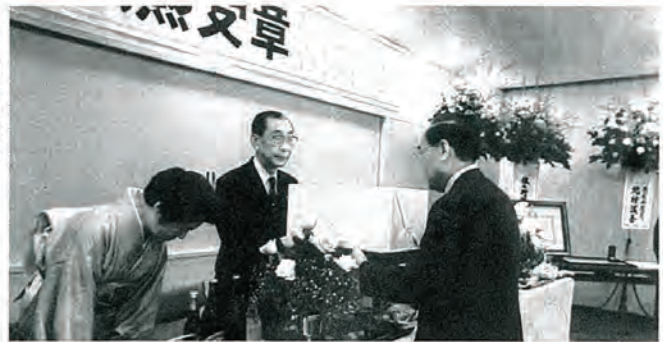
受章を祝って清原町長から記念品が渡されました。