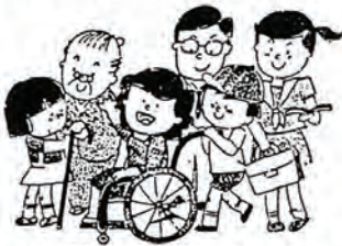
あなたの善意と能力を多くの人々が誇っています。

日頃、ひとり暮らしのご老人方と文通や高校の文化祭などへ招待したり、社会福祉協議会主催のふれあい招待会での