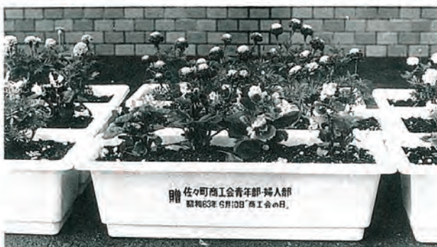
贈 佐々町商工会青年部・婦人部 昭和63年6月10日 商工会の日。