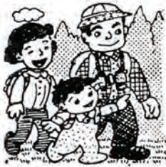
自然に親しむ運動 (7月21日～8月20日)