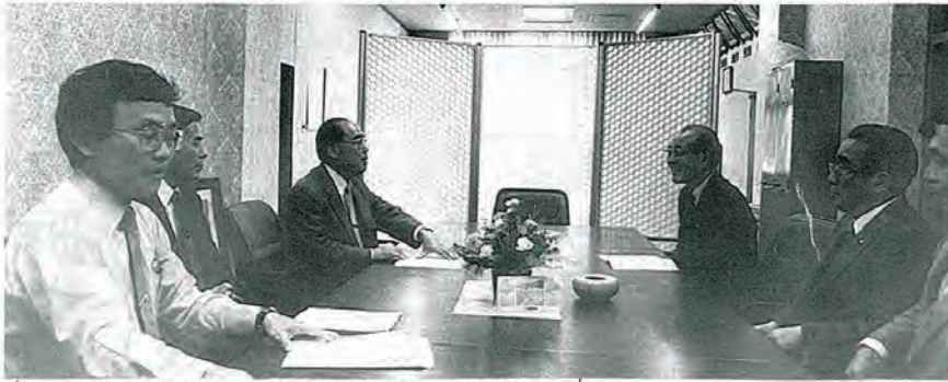
山喜(株)社長が佐々町を訪れ、今後の計画等を説明。当初計画から5年目でやっと着工へと進んだと談笑。