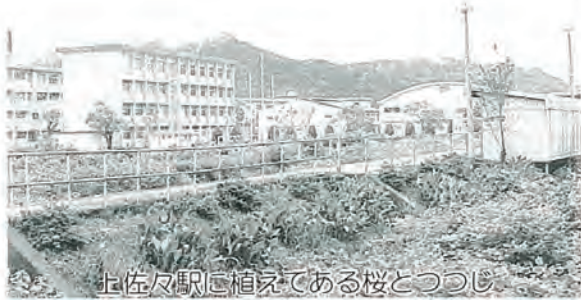
上佐々駅に植えてある桜とつつじ

十本程で、折を見て、「またします」と駅周辺は花でつつまれることでしょう。ありがとうございました。