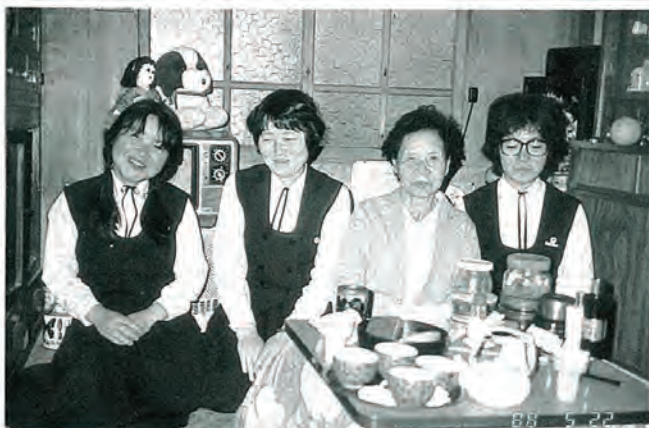
88 5 22