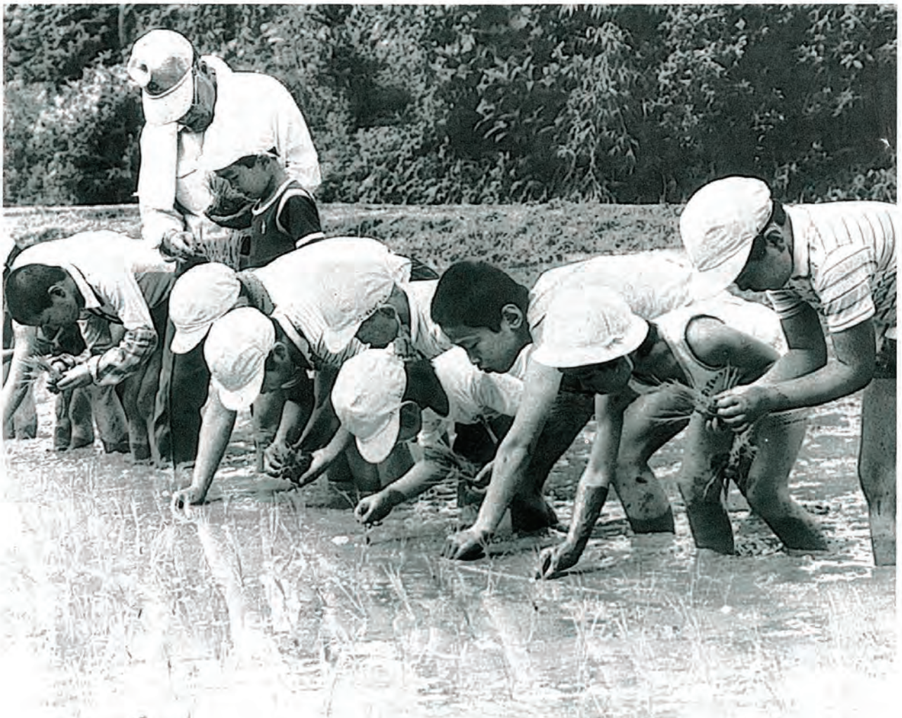
口石小学校生徒の(勤労生産学習)田植えの様子