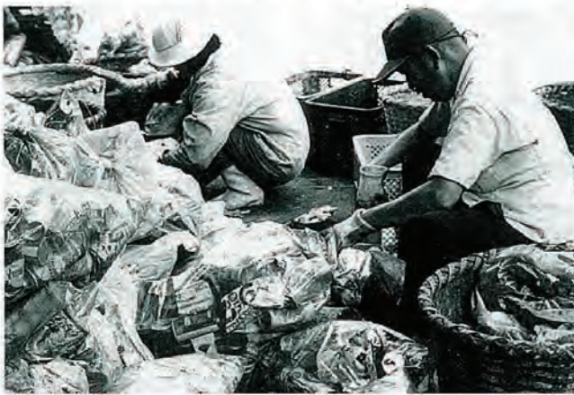
写真は塵芥処理場の選別作業

佐々川上流の世知原から佐々町干拓附近まで、汚染の度合いを目で確かめたり、佐々町浄水場の浄化状況の説明、佐々町塵芥処理場での選別や集収についての問題点を聞くなど、これからの調査活動への見聞を深めた。 同校は、そのほかにも「高齢化社会への対応」など、美しく老いる新生活のための事業を考えているが、その展開に期待したい。