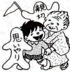
秋の全国交通安全運動 (9月21日～30日)