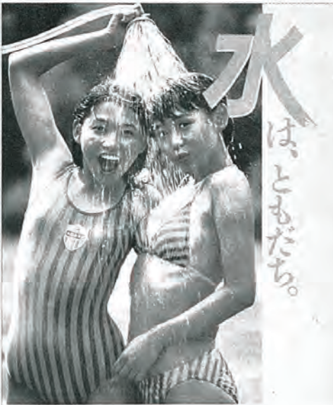
第11回 水は思いある貴重な資源です。 水の週間 8月1日→7日 国土庁・都道府県

り、水道事業は公営企業であり、水道使用者の料金収入で運営されています。担当でも極力経費の節減につとめ、事務の合理化、有収率向上等により、健全な経営を目指し努力いたしています。