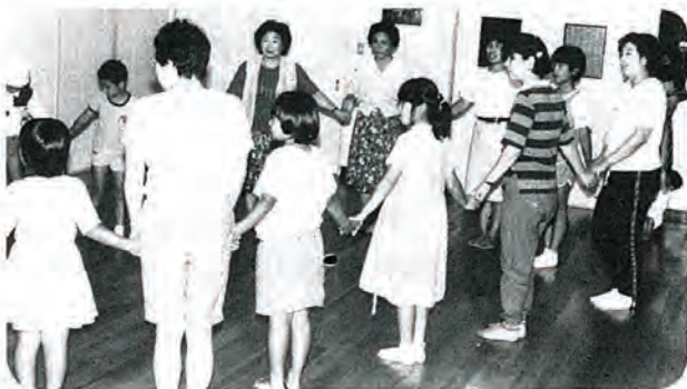
「写真は、さざん花町内会学習活動スナップから」

この中で、子供に及ぼす影響が大きい「夫婦げんか」について、家庭内の人間関係の不和やいざこざが、子供の人間形成に深く入り、それがしばしば非行や問題行動をひきおこす大きな原因となってい