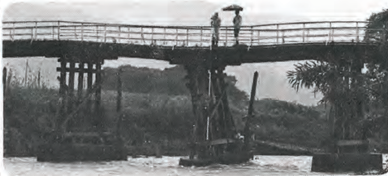
→七月九日の大雨により、損傷を受けた小春橋 ↓六十二年度の架替工事完成が待たれる小春橋

橋梁は、長さ六十メートル、巾七メートルのうち、車道部五メートル、歩道部二メートルとなっており、車から人命を守るための歩道があり、児童生徒の通学路として、一日も早い完成が待たれます。