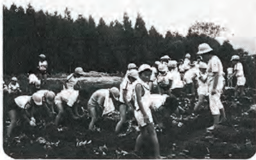
先生も、生徒も ハダシで農作業

四月末から七月にかけて、町内の小中学生が入園し、見事な農園栽培ができました。自分達の手でみんなが力をあわせ、汗を流しながらの作業、はつらつとした子供達の笑顔をいつまでも大事にしたいものです。