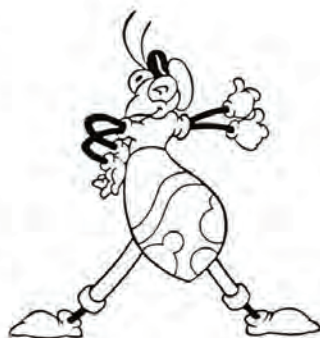
道案内をすると言われる虫、ハンミョウ

例えば、都市内で、都市計画法に定められた計画どおりにでき上がっている道路は、まだ三九・八%にすぎません。 今後、ますます進む日本の「車社会」それを支える道の重要性をいま一度考えてみてはいかがでしょう。