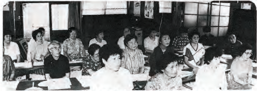
～写真は、西町婦人学級スナップから～

そのためには、最近の子どもの傾向をよく知る。又子どもを育てていくうえで地域の教育力が必要であり、お母さんたち、主婦の力に負うとこ