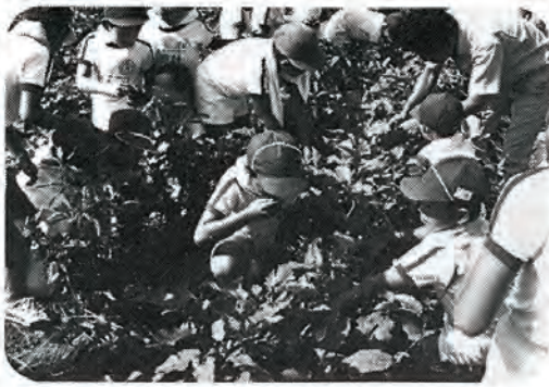
ナス・ピーマンの収穫に、大喜びの児童たち。