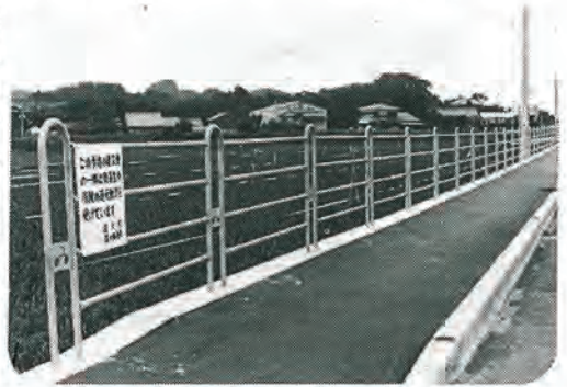
排水路九ヶ所の建設費の一部に総額七八、八〇〇千円が融資されております。

佐々町においても昭和六十年度に、町道二路線、農道二路線、林道一路線、防火水槽二基、学童農園(童の館、キャンプ場、遊歩道)、歩道、