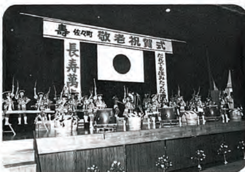
おじいちゃんおばあちゃんへの敬老のお祝にと、保育所園児による「さざんか太鼓」。

引続いて、町内保育所の可愛い園児たちによる、さざんか太鼓、舞踊家の方々による踊りなどに拍手を送りながら、なつかしい昔話に、ひとときを心ゆくまで楽しまれ、再会の約束しながら、送迎バスなどで家路につかれました。