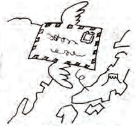
国際文通週間 (10月6日～12日)