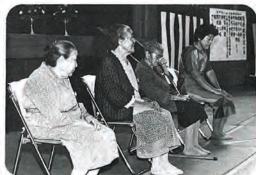
米寿を迎えられる四名のみなさん元気で出席。

この血のじむような体験を、どうか子々孫々に語り継いでいただきますようお願いいたしますと共に、良きおじいちゃん、おばあちゃんとして、私達の模範となっていただき