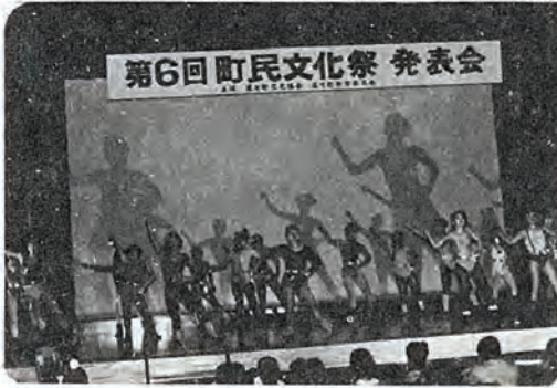
第6回町民文化祭 発表会

第一日目の二日は、住民総合センターを中心に、盆栽、生花、絵画、写真等が多く出展され、見事な出来映えに参加者の目を楽しませてくれ、また、健康センターでは、福祉展が催され、老人作品展や