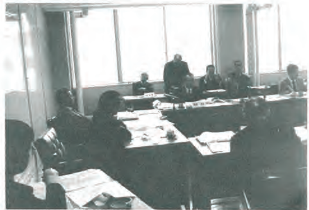
(3月3日、県議会厚生委員会の審議)