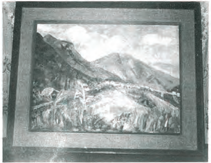
佐々川河畔からの眺望 佐々町口石免