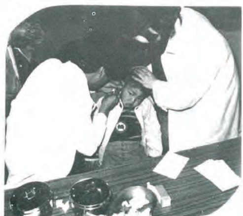
(人気があった血液型判定)