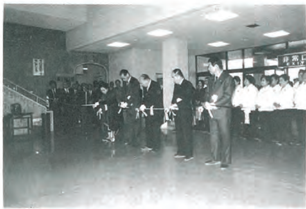
(テープカット・町民体育館ロビー)