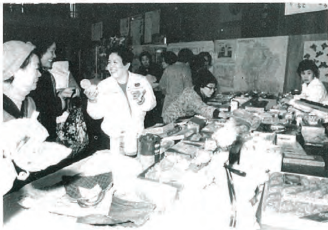
人気があつまったコーナー