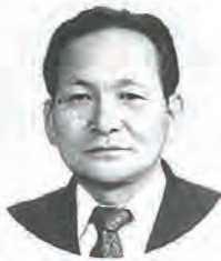
長崎県議会議員 林 勇氏