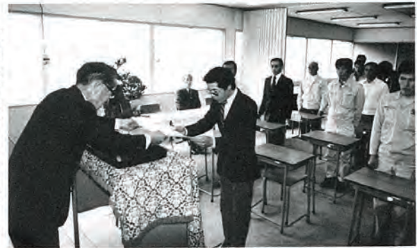
〔写真は、修了証書を受ける修了生代表〕