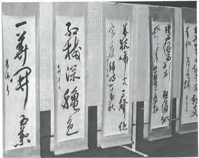
文化協会書道作品展から