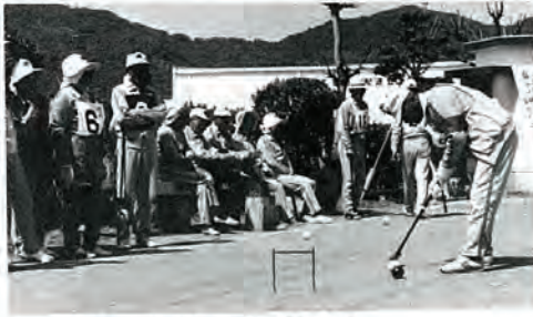
ゲートボールに興じる 老人クラブのみなさん

あなたは医者や病院を転々と渡り歩いたり、むやみに薬を求めたりしているようなことはありませんか。経過が思わしくないと、すぐお医者さんをかえる人がいますが、そのたびに検査や治療、薬剤などが重複して、かえって病状が悪化することがあります。それは誤った受診の仕方です。そのうえみんなの大切な国保税が無駄に使われることになりません。又忙しいお医者さんのことも考えて、夜間・休日の診療や往診も、急患の場合以外はできるだけ避けるようにしましょう。