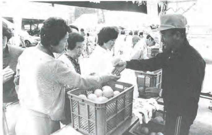
メロン売も板につきました

遠く佐世保市からの来客も多く、メロン、イチゴは早々と売り切れ今年も生産者のみなさんのうれしい悲鳴が聞かれましたが、八日の正午頃からは品不足のため、来場されたお客さんに不評を買ったことは反省すべきだと思ふ。