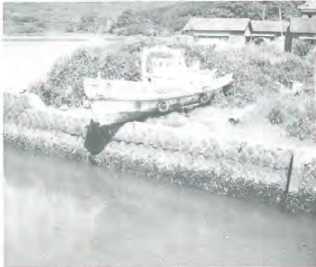
写真は事故のあった真申町内会の海岸

夏の暑さはわたしたちを水辺へと駆り立てます。海、川、谷川のせせらぎ…。夏は水が恋しくなる季節です。しかし、わたしたちが水と親しくなるほど、水難事故が多くなることも見逃がせません。事故の大半は6月～8月の間に集中しているのです。