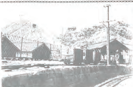
昭和初期の炭鉱風景

志方の海岸までの約二キロに九尺巾(約一、七メートル)の道路をつくり、その片側にレールを敷き、半トン積みのトロッコを人間が押して運んでお