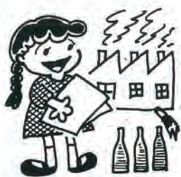
環境衛生週間 9月21日～27日