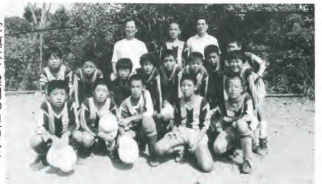
写真は、健闘の口石小チームのみなさん

この大会は、小学校の部、二十一チーム、中学校の部、十八チームが出場して行われ佐々町からも佐々小チームと口石小チームが出場しました。口石小チームは順調に勝進み、優勝候補の江迎小チームをPK戦で破り決勝へ進出しましたが、佐世保市の広田小チームに延長戦の末、惜しくも三