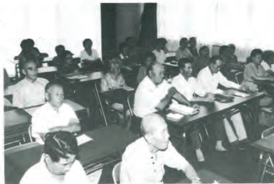
明生大学(高齢者学級六〇名)