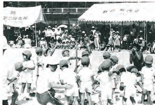
みんな、いっしょにガンバリました。

十月二日、千本公園運動場で町内四保育所の運動会が行われ、チビっ子選手が活躍しました。