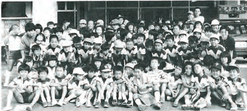
写真「上」は佐々小、「下」は口石小児童の皆さん