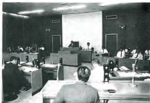
(町議会審議の様相)