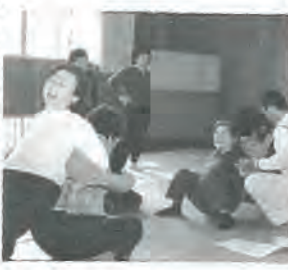
楽しいスポーツのひととき (婦人学級)