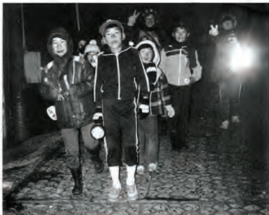
「火の用心」に廻わる 元気な大茂子供会の皆さん