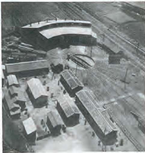
ありし日の佐々機関区 (昭和40年頃)

春炬燵掛布のすその垢目立つ 東風吹いて春の足音梅も聞く 春一番雪崩を告げる山の声 春雷の山脈に建つ新墓標 越冬に堪えて芽を出す春の花 頬かむりしてゲートボール春を打つ 新春の夜明を告げる除夜の鐘 星霜が去り又巡り喜寿の春 土手柳春を見つけた子等はしやぐ 選挙後の春は値上げで幕があく 炬燵から出て背伸びする春の風 就職も決まり春待つ初背広 新春が来たまた新しきドラマかも ウインドに一足早い春の彩 ほのぼのと友の賀状の春一句