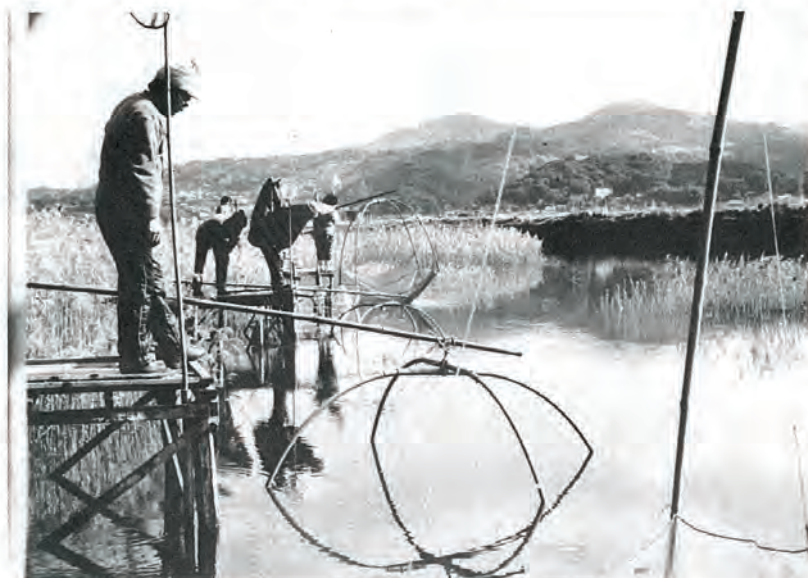
佐々川に四ツ手網をおろし白魚とりをする人々

例年、立春を過ぎるころには佐々川に四ツ手網がおろされ、多くの白魚とりの人たちでにぎわうのであるが、今年二月初めの強い寒波で、白魚も足をとめていたらしく、中旬過ぎ春めいた陽光とともにやっと白魚も上り始めた。最盛期ともなると、約八十を 越す網があるされ、遠くは福岡方面からも「白魚」を取りに来るといふほどで、元の旅館や食堂などでもお膳をにぎわせる春の味覚である。白魚の「おどり喰い」、あおさと豆腐の吸物、カラあげなどが美味しいと賞味されている。