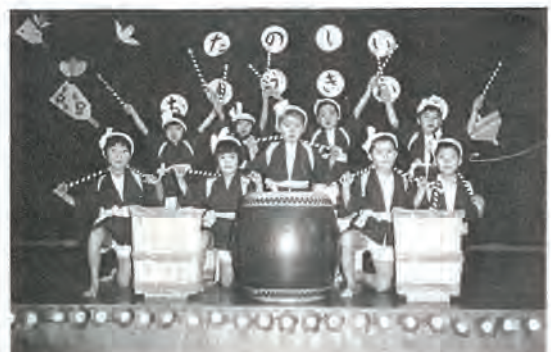
写真は、第二保育所園児のちびっ子太鼓

町立保育所（第一、第二、第三）では、一月二十二日、日ごろの保育時間に練習したゆうぎの発表会が行われ、集まった多くのお父さん、お母さんや家族のみなさんの拍手をうけました。