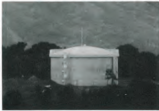
東光寺山頂に完成した三千トンパック

町の浄水場では施設の近代化を図る一方、水道事業の使用命である「清浄、豊富、低廉」を合言葉に円滑な給水につとめようと、日夜真剣に取り組んでいます。各ご家庭でも限りある水を上手に使うよう工夫していただき、節水にご協力をお願いいたします。