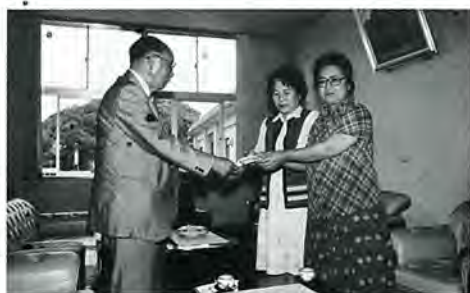
町長に益金を手渡す商工婦人部

元気のよい地元青年のメロン売りの声も五回目とあってなかなか胸に入ったもので、おいしいメロンの売れ行きも上々、イチゴなど二日目の昼ごろには、早々品不足になるというハブニングもあり、主催者側からうれしい悲鳴も聞かれました。