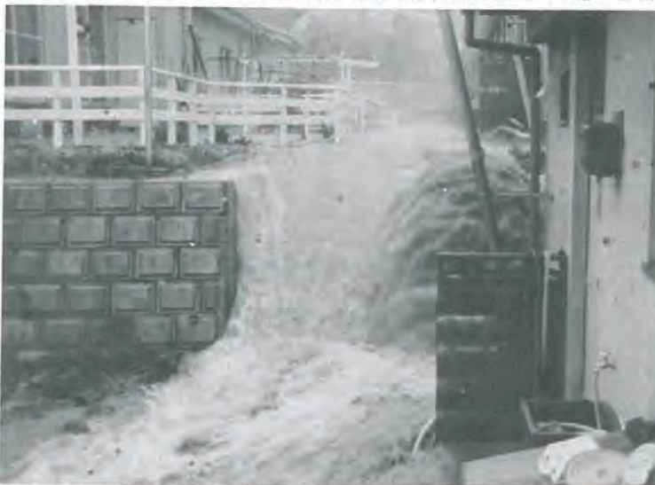
(写真のように、いつ、どこに、どのようなかたちで襲ってくるかも……。)

月下旬から七月上旬にかけては局地的な大雨の恐れがあるとの予報があり、集中豪雨による災害が予想されます。家庭や地域でも万全の防災対策をたてましょう。 特に次の点について注意して下さい。 ▼家の回りの下水溝や水路